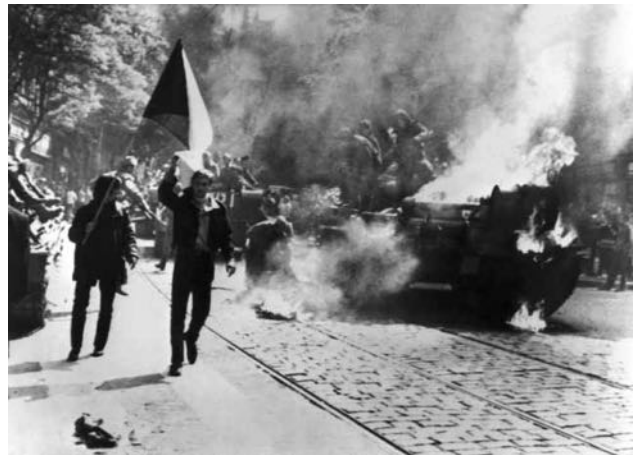
Prag im August 1968: Sowjetische Panzer kämpfen gegen einen menschlichen Kommunismus.

Katholiken gegen Protestanten in Nordirland. In Nordirland beginnen bürgerkriegsartige Auseinandersetzungen zwischen den politisch benachteiligten Katholiken, den ursprünglich keltischen Einwohnern, und der protestantischen Mehrheit der im 19. Jh. zugewanderten Briten.