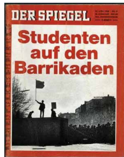
Mai 1968: Titelbild des deutschen Nachrichtenmagazins „Der Spiegel“

Im Mai 1968 schwappt die Jugendrevolte auf Paris über. Die Studenten lehnen sich gegen überholte politische, soziale oder kulturelle Verhältnisse auf. Lautstark fordern sie Veränderungen, mit „Happenings“ wie regelmäßigen Demos, spontanen Sit-ins (Sitzstreiks) und provokativen Go-ins (Störaktionen). Als Protest gegen die bürgerliche Gesellschaft propagieren und konsumieren sie Drogen. Es ist ein Generationenkonflikt, eine neue Jugendbewegung und ein Aufblühen linker Ideologien. Die Achtundsechziger sind Rebellen, sie sind antikapitalistisch, konsumkritisch und autoritätsfeindlich. Ihre Idole sind die Führer der kommunistischen Aufstände, von Mao (China) über Ho Chi Minh (Vietnam) bis zu Che Guevara (Kuba). Ihre Bibel ist „Das Kapital“ von Karl Marx - aber kaum einer der „Bewegten“ hat mehr als zehn Seiten daraus gelesen.