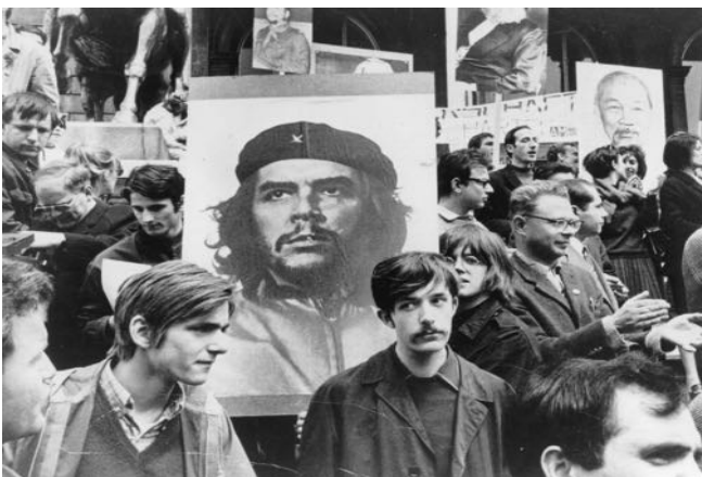
Studentenprotest 1968 in Deutschland mit den Porträts von Che Guevara und Ho Chi Minh

Auch an Deutschlands Universitäten wurde demonstriert. Neben der Kritik am „Kapitalismus“ und „Imperialismus“ gab es in Deutschland drei große Themen: