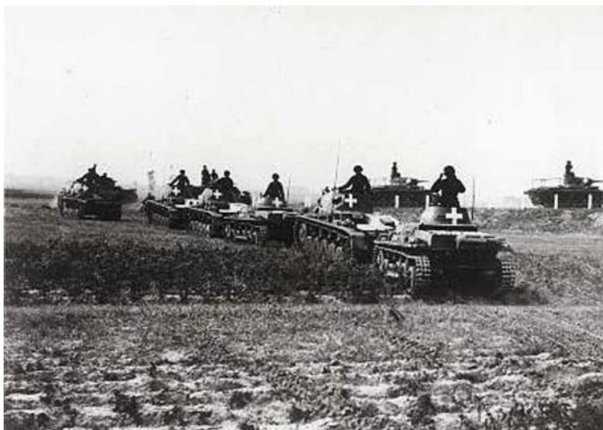
Deutsche Panzer rücken in Polen vor.

Hitler forderte von Polen die Wiedereingliederung der Stadt Danzig ins Deutsche Reich (die Stadt war nach dem Ersten Weltkrieg im Vertrag von Versailles als „Freie Stadt“ erklärt worden). Zudem verlangte Hitler eine exterritoriale Verbindung nach Ostpreußen durch den sogenannten „polnischen Korridor“ (Autobahn und Schiene). Die polnische Regierung lehnte beides in Absprache mit Frankreich und England ab. So brach Hitler den Krieg vom Zaun. Dieser „Polenfeldzug“ war schon nach