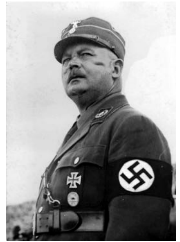
Ernst Röhm, Führer der SA