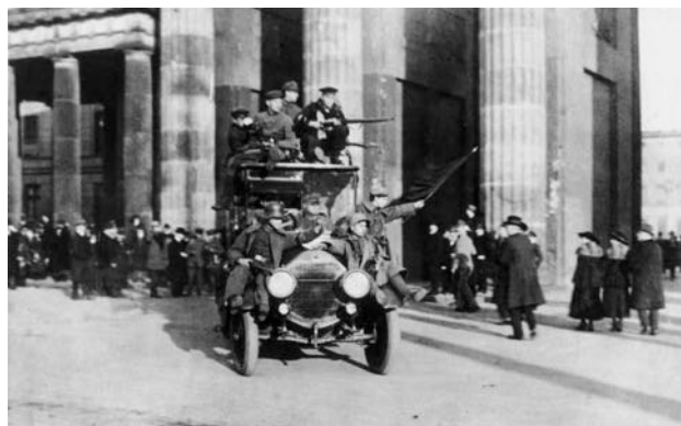
1918: Novemberrevolution der Matrosen und Frontsoldaten, Brandenburger Tor

Durch die militärische Niederlage von 1918 kam zwar das deutsche Kaisertum zum Fall, und die Deutschen hatten endgültig genug von der Monarchie / doch die monarchistische Gesinnung vieler Deutscher blieb erhalten. 1918/19 gab es einige kommunistischen Umsturzversuche, doch alle scheiterten / die Erfolg hatten (in Kiel, Berlin und München). Die Führung der Weimarer Republik übernahmen die