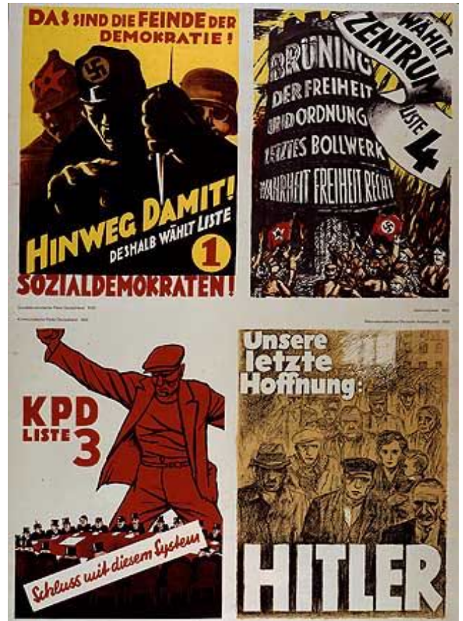
Wahlplakate 1930 - 32

Wirtschaftskrise und betonte Demokratie / antidemokratische Einstellung förderten den Aufstieg der beiden extremen / gemäßigten Massenparteien, der Kommunisten und der Nationalsozialisten. Die Zahl ihrer Mandate schwoll an, ihre Privatarmeen erhielten Zulauf aus der Oberschicht / von Arbeitslosen (die SA, Hitlers „Sturm-Abteilung“, hatte nun fast eine halbe Million Mitglieder). Die Schlägertrupps beherrschten die Straßen mit Terror gegen Andersdenkende. Als die Regierung Brüning versuchte, die Situation mit öffentlichen