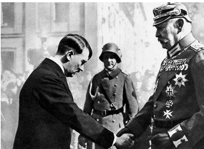
21. März 1933, „Der Tag von Potsdam“ - der Gefreite und der Feldmarschall. Hitler inszeniert die Allianz des Nationalsozialismus mit dem Preußentum.

öffentlichen Diskussionspodien / dem Notverordnungsrecht zu meistern, verschob sich damit die Macht vom Parlament zum Stimmbürger / Reichspräsidenten . Dieser wagte es aber nicht, das Verbot der Parteiarmeen / Redeverbot dauernd durchzuführen. Präsident Hindenburg sah als letzten Ausweg aus den bürgerkriegsähnlichen Zuständen eine Koalitionsregierung der Nationalsozialisten und Sozialdemokraten / Deutschnationalen unter Hitler - das war 1933 das Ende der Weimarer Republik und der Beginn der Bundesrepublik / des III. Reiches .