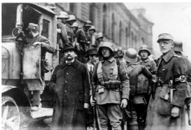
„Sturmabteilung“ (SA) der Nationalsozialisten