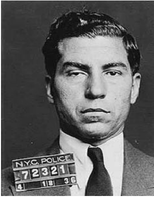
Der legendäre Charles „Lucky“ Luciano (1897-1962) war Padrone der Cosa Nostra in New York.

Die Mafia entsteht im Sizilien des 18. Jahrhunderts als Selbstschutzorganisation gegen Obrigkeitwillkür. Mit der Zeit wandelt sich der Geheimbund in eine regelrechte Subkultur. Zunächst zeichnen sich die Mitglieder dieser „Ehrenwerten Gesellschaft“, wie sie sich selber nennen, durch ein bestimmtes Sozialverhalten aus. „Omertà“ (Schweigen) und „Vendetta“ (Rache) bestimmen das Zusammenleben in der Mafia und das Auftreten gegen außen. Die Mafia-„Familien“ nutzen ihre sich entfaltende Macht zur illegalen Bereicherung.