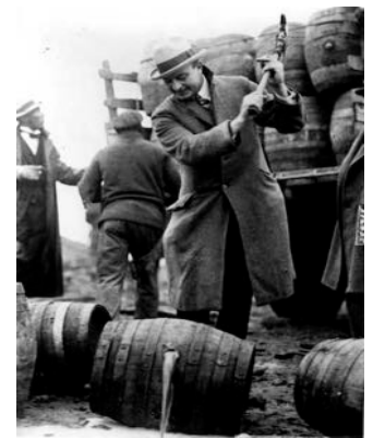
Unter Aufsicht von Beamten müssen die Händler den Alkohol vernichten.

Als 1920 in den USA das Prohibitions-gesetz , das totale Alkoholverbot, in Kraft trat, eröffnete sich dem organisierten Verbrechen ein äußerst einträgliches Betätigungsfeld: illegale Herstellung und Schmuggel von Alkohol.