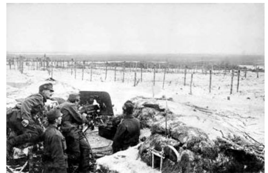
Österreichisch-ungarisches Militär an der Ostfront

Klassenkampf wichtiger war als der Machtkampf zwischen den Völkern. Ende November bot Lenins Regierung den Mittelmächten den Waffenstillstand an, und Mitte März 1918 unterzeichnete sie den Friedensvertrag von Brest-Litowsk , in dem Deutschland außer den bereits besetzten Gebieten Polen und Litauen auch die Abtretung von Estland und die Räumung Finnlands und der Ukraine verlangte. Russland verlor damit einen Drittel seiner Einwohner (56 Millionen), einen Drittel seiner Eisenbahnstrecken, drei Viertel seiner Eisenerz- und neun Zehntel seiner