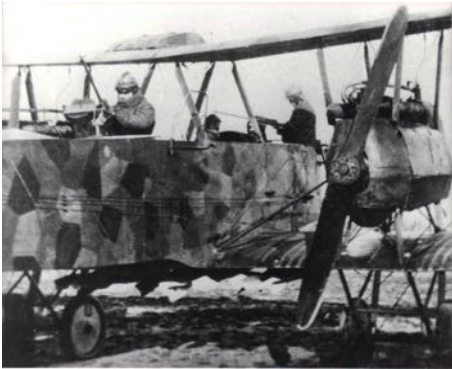
Ein Gotha-Bombenflugzeug kurz vor dem Start. Ziel der Bombardierungen war, die Bevölkerung im feindlichen Land zu terrorisieren.

Kohlenförderung und über fünftausend Fabrikanlagen; es musste außerdem eine Kriegsentschädigung von sechs Milliarden Mark bezahlen. Lenin bezeichnete den Frieden als schändlich, war aber überzeugt, die Mittelmächte würden den Krieg schließlich verlieren, und dann werde dieser Vertrag ungültig sein . Wenig später unterwarf sich auch Rumänien einem ähnlichen Sonderfrieden.