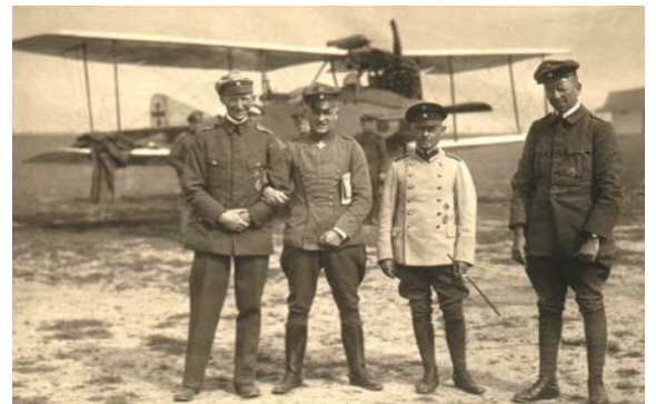
Die Jagdflieger sahen sich als „ Ritter der Lüfte “ und wurden in der Heimat gefeiert wie heute die Spitzensportler, während Hunderttausende von Soldaten in anonymen Massengräbern verscharrt wurden (1917 hatte die Heeresleitung sogar das Tragen von Trauerkleidern für die Angehörigen verboten). In Wirklichkeit war der Luftkampf kaum ein heldenhafter Zweikampf, sondern ein brutales und heimtückisches Morden. Der zweite von links ist der berühmte berüchtigte Freiherr Manfred von Richthofen, der „Rote Baron“ (Juni 1917).

Flugzeuge waren mit zwei Motoren ausgerüstet, schneller als die Jagdflieger und konnten auf über 5000 Meter hoch steigen. Bei einem Terrorangriff deutscher „Gothas“ auf London fanden mehr als 500 Menschen den Tod. Das war der Beginn des Krieges gegen die Zivilbevölkerung , der im dann im Zweiten Weltkrieg einen furchtbaren Höhepunkt erlebte.