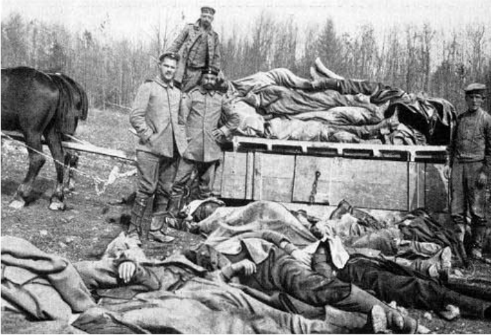
Nach Offensive und Gegenoffensive erfolgt jeweils für Tausende der Transport ins Massengrab (gefallene deutsche Soldaten 1917).

Unermesslich sind die Leiden der Soldaten an der Front. Dieser Streifen des Todes geht, weil die Mittelmächte (Deutschland, Österreich-Ungarn, Bulgarien und Türkei) einen Zweifrontenkrieg führen, zweimal quer durch Europa: von der Kanalküste bis an die Schweizer Grenze (Westfront), von dort bis nach Triest (Piave- und Isonzofront), und dann parallel dazu vom Baltikum zum Schwarzen Meer (Ostfront).