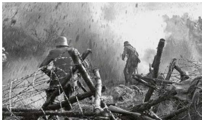
Deutsche Soldaten im Feuer der französischen Artillerie.

Schneller als erwartet waren inzwischen die Russen in Ostpreußen eingedrungen. Bei Tannenberg verloren sie 50 000 Tote und 90 000 Gefangene, und an den Masurischen Seen wurde der größte Teil ihres Heeres ertränkt. Der siebenundsechzigjährige General von Hindenburg stieg über diese Siege an der Ostfront zum vergötterten deutschen Helden empor, der den Endsieg verbürgte.