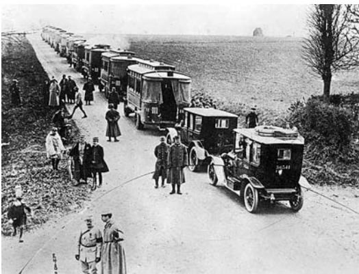
Pariser Taxi und Omnibusse stehen bereit, um französische Soldaten an die Marne-Front zu transportieren.

die Wand gestellt und erschossen, ganze Stadtteile wurden niedergebrannt.