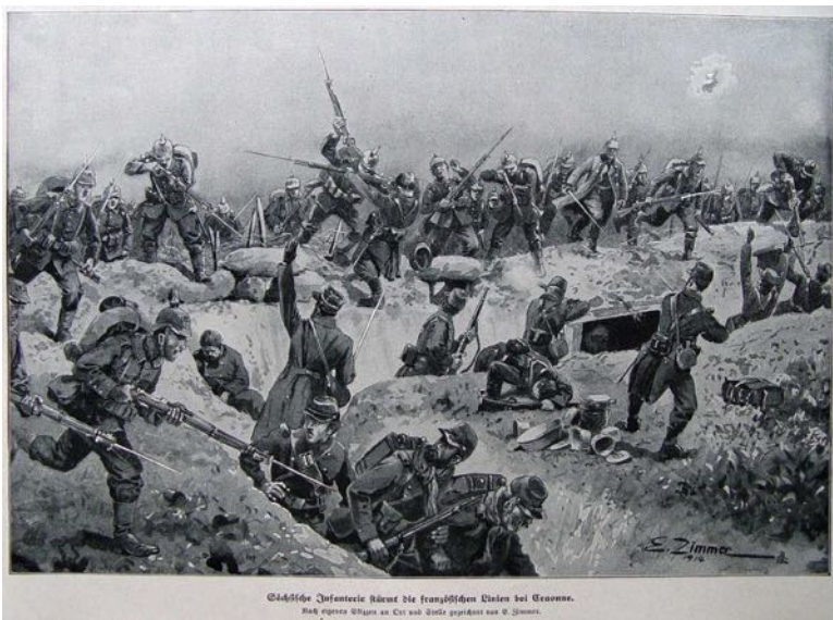
© 1914/15 Infanterie führt die französischen Soldaten bei Gravelotte. Nach eigenen Skizzen an C. v. D. v. Zimmer gezeichnet von S. Zimmer.

An der russisch-österreichischen Front siegten dagegen die Russen . Sie besetzten Galizien, überstiegen von dorthier die Karpaten und gelangten bis an den Rand der Ungarischen Tiefebene.