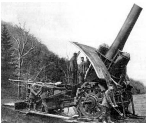
Die „ Dicke Bertha “ verschoss 800 kg schwere Granaten 10 km weit.

Frankreich sollte in die Zange genommen werden, indem die deutsche Hauptmacht nicht über die stark befestigte