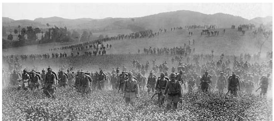
Deutsche Truppen beim Vormarsch in Flandern. In den ersten Stunden des Krieges sahen die „Offensiven“ noch recht gemächlich aus.

Weil Großbritannien in den Krieg eintrat, musste der Schlieffenplan abgeändert werden: Anstatt Paris zu umzingeln stießen die deutschen Spitzentruppen bis an den Kanal vor - sonst wären ihnen die Briten in den Rücken gefallen.