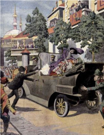
Auf einer Rundfahrt durch Sarajewo am 28. Juni 1914 wird das österreichische Thronfolgerpaar von einem serbischen Gymnasiasten erschossen.

Das Attentat auf das österreichische Thronfolgerpaar in Sarajewo ist der unmittelbare Anlass zum Ausbruch des Weltkrieges.