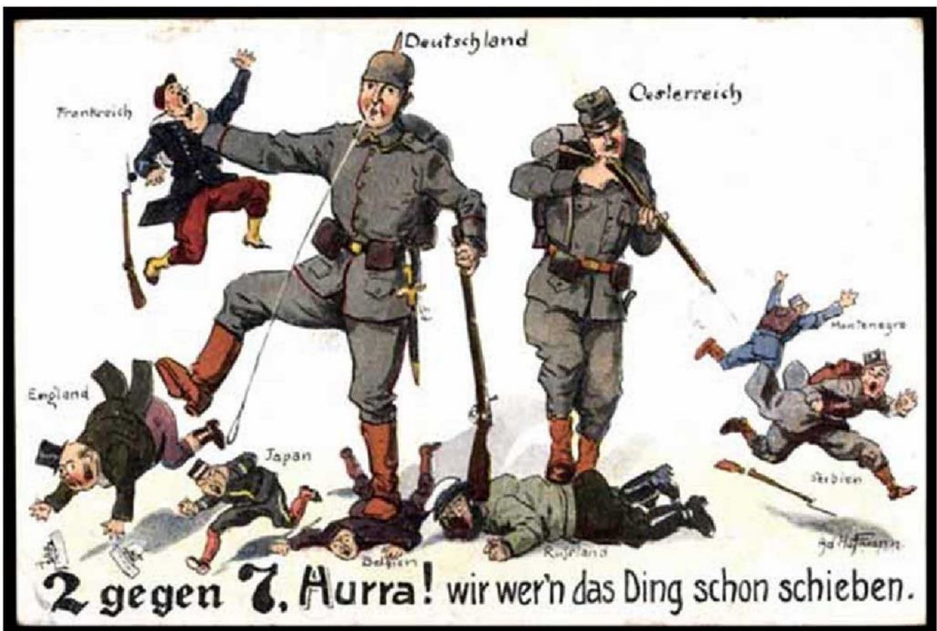
Deutsche Propagandakarte von 1914 - die Wirklichkeit sah dann entschieden anders aus.

Anfangs August befand sich der größte Teil Europas im Kriegszustand.