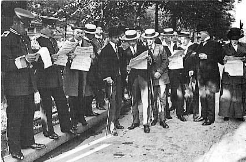
Juli 1914 in Berlin „unter den Linden“, als es weder TV mit Public Viewing noch Internet mit Live Ticker gab. Bei wichtigen Ereignissen erschien mehrmals am Tag ein Extrablatt.

Franz Ferdinand war in Österreich nicht sonderlich beliebt, in den slawischen Gebieten sogar verhasst gewesen. Er war der Neffe des 84-jährigen Kaisers Franz Joseph und sein