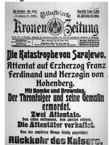
Die „Illustrierte Kronen Zeitung“ aus Wien, vom 29. Juni 1914

Am 28. Juni verbreiteten die Extrablätter die Meldung vom Attentat in Sarajewo , bei welchem der Gymnasiast Gavrilo Princip, ein Mitglied des serbischen Geheimbundes „ Schwarze Hand “, Erzherzog Franz Ferdinand und dessen Frau mit Revolverschüssen getötet hatte, kurz nachdem ein Bombenattentat fehlgeschlagen war.