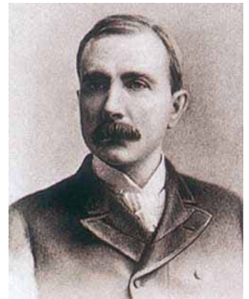
John D. Rockefeller, der „Petroleumkönig“ (um 1875)

John D. Rockefeller war zuerst Tellerwäscher und Ausläufer gewesen, der 4 Cents die Stunde verdiente. Nun aber übernahm er einen Krämerladen. Er verkaufte Gemüse, Hosenträger, Kerzen und Petrol. Als er eines Tages für den Einkauf bei den Ölfeldern weilte, begann er, sich für die Gewinnung des Petroleums zu interessieren. Er beobachtete die Bohrungen, den Transport des Rohöls in die Raffinerien , wo es veredelt wurde. Das bei der Destillation entstehende Benzin und Schmieröl ließ man damals noch als lästige Nebenprodukte in Flüsse und Seen ablaufen.