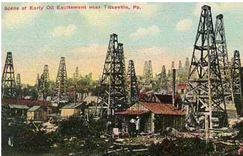
Erste Ölförderung: Titusville, Pennsylvania.

John D. Rockefeller war zuerst Tellerwäscher und Ausläufer gewesen, der 4 Cents die Stunde verdiente. Nun aber übernahm er einen Krämerladen. Er verkaufte Gemüse, Hosenträger, Kerzen und Petrol. Als er eines Tages für den Einkauf bei den Ölfeldern weilte, begann er, sich für die Gewinnung des Petroleums zu interessieren. Er beobachtete die Bohrungen, den Transport des Rohöls in die Raffinerien , wo es veredelt wurde. Das bei der Destillation entstehende Benzin und Schmieröl ließ man damals noch als lästige Nebenprodukte in Flüsse und Seen ablaufen.