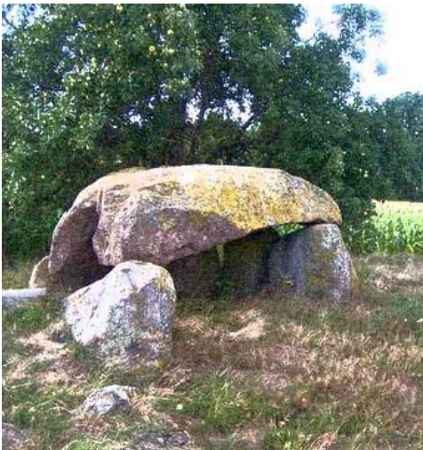
Neolithische Megalithanlage, im Volksmund Hünengrab (Grab für Riesen) genannt. Ursprünglich waren die Steinplatten von einem Erdhügel überdeckt.

Zunächst war der Pflug nur ein von Menschen gezogener hakenförmiger Baumast, später wurde an dessen Ende ein Stein als Pflugschar befestigt und vor diesen Pflug ein Rind gespannt. Damit ging die schwere Arbeit der Feldbestellung an den Mann über. Die Erfindung des Rades und des Wagens erleichterte das Einbringen der Ernte.