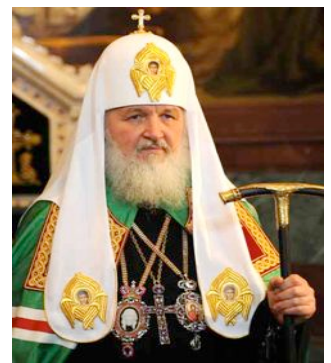
Der Patriarch Kyrill von Moskau

Orthodoxie heißt eigentlich Rechtgläubigkeit. Man versteht darunter auch das strenge Festhalten an einer kirchlichen Lehrmeinung im Gegensatz zu freieren Auffassungen.