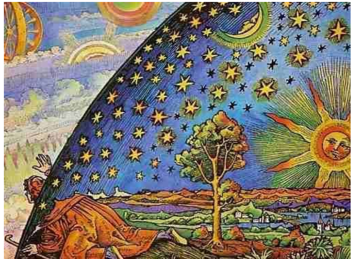
Das mittelalterliche geozentrische Weltbild . Spätere Karikatur.

Es wurden nicht nur Bibeln und wissenschaftliche Abhandlungen gedruckt, sondern auch Millionen kleiner Werke. Die Bücher der damaligen Zeit widerspiegeln die Volkskultur. Sie wurden von hausierenden Buch- und Zeitschriftenhändlern, den Kolporteurs, angeboten: Jahrbücher, Ritterromane, Heiligengeschichten, Märchen und politische Hetzschriften.