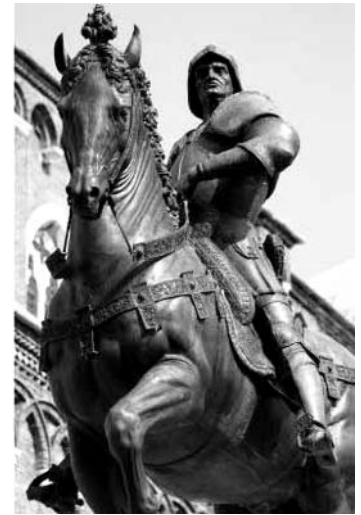
Statue eines Condottiere (Söldnerführers) in Venedig. Er nimmt die kraftvolle und bestimmende Haltung eines Renaissancemenschen ein, ohne Demut - sogar sein Pferd wirkt herrisch.

Nachdem das Mittelalter fast tausend Jahre gedauert hat, zieht in Italien die Morgenröte einer neuen Zeit hinauf, die das Menschenbild und das Wissen, ja das gesamte Leben in Europa verändern wird: die Renaissance. Hundert Jahre reichen, um den Lauf der Geschichte umzukrempeln: Zwischen 1450 und 1550 entsteht eine andere Welt: Die Ritter verlumpen und ihre Burgen zerfallen. Die Städte gewinnen an Bedeutung, die Bürger werden wohlhabend. Mit Spanien, Frankreich und England bilden sich große europäische Königreiche. Aus dem Latein und aus dem Germanischen entwickeln sich Nationalsprachen: Italienisch, Französisch; Deutsch. Der Buchdruck wird erfunden, die Taschenuhr, der Kompass, neue Handelsrouten werden erschlossen und fremde Kontinente entdeckt, Bankschecks werden eingeführt, Söldnerheere werden mit Feuerwaffen ausgerüstet, Kopernikus lässt die Erde um die Sonne kreisen, Martin Luther begründet einen neuen Glauben.