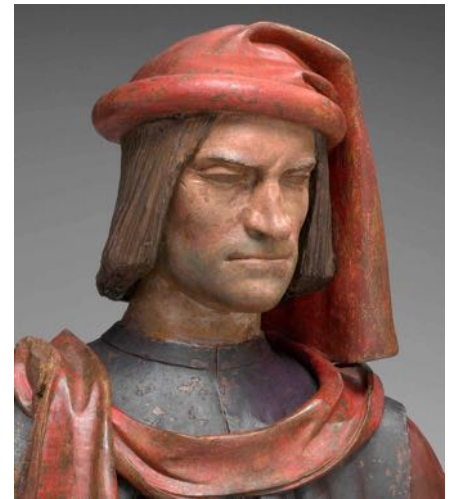
Lorenzo il Magnifico aus dem Geschlecht der Medici. Zeitgenössische Statue. Den Zunamen „der Prächtige“ erhielt Lorenzo durch sein Mäzenatentum, seine großzügige Förderung der schönen Künste: Literatur, Malerei, Bildhauerei und Architektur. Zu den geförderten Künstlern zählten unter anderem Sandro Botticelli und Michelangelo Buonarroti. Unter Lorenzos Herrschaft wurde Florenz die wichtigste Stadt der Künste während der Renaissance.

Ein Gegentrend zu Renaissance und Humanismus: 1275, im Hochmittelalter, war in Toulouse die erste Hexe verbrannt worden. Im Spätmittelalter nahmen die Hexenprozesse zu, erreichten dann in der Renaissance und im Barock einen Höhepunkt. Im 16. und 17. Jahrhundert endeten mehrere Tausend Personen wegen Hexerei auf dem Scheiterhaufen, in Frankreich, in Deutschland und in England.