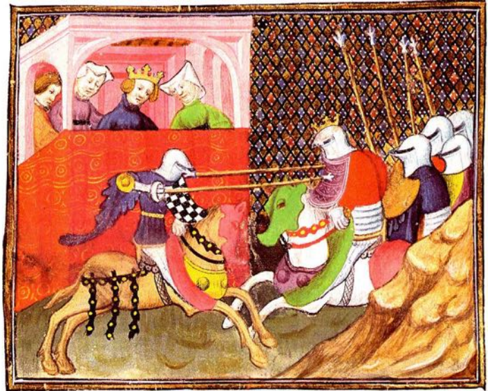
Tjost (Turnier), Darstellung aus dem 14. Jh.

Die Knappen lernten, was ein angehender Ritter können musste: gut reiten, schnell auf- und absitzen, rennen und wenden, schwimmen und tauchen. Ein Knappe lernte mit Armbrust und Bogen schießen, auf Leitern steigen, einer Stange und dem Seil hochklettern. Er lernte ringen