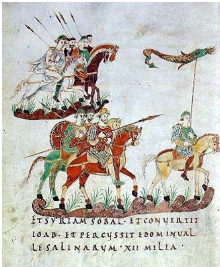
Fränkische Reiterei Karls des Großen (9. Jh., zeitgenössische Darstellung)

Der germanische Heerbann im frühen Mittelalter bestand aus allen wehrfähigen Freien. Diese kämpften meist zu Fuß. Die germanischen Heere erwiesen sich zu schwerfällig im Kampf