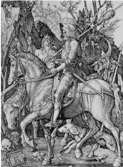
Ritter, Tod und Teufel , Stich von Albrecht Dürer aus dem Jahr 1513. In jener Zeit gehen Mittelalter und Rittertum unwiderruflich zu Ende.

Die Töchter der Ritter erlernten unter der Obhut der Mütter Hausarbeit, Krankenpflege und kunstvolle Handarbeiten . Sie erhielten auch Unterricht im Musizieren, Lesen und Schreiben, oft in der französischen und lateinischen Sprache. Die Edelfrau nahm im gesellschaftlichen Leben einen hervorragenden Platz ein; ihr oblag die Pflege der Festlichkeit und der höfischen Sitten. Ihrer Herrin zu Ehren kämpften viele Ritter im Turnier und feierten die edlen Frauen in der hohen