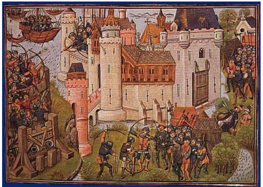
Eine Belagerung während des Hundertjährigen Krieges (1337 – 1453), zeitgenössische Darstellung

Über eine Zugbrücke und durch ein mit Fallgittern geschütztes Tor betrat man den Burghof . Große Burgen besaßen oft mehrere Höfe – z.B. Vorhof und Haupthof. Um den Haupthof herum drängten sich die wichtigsten Gebäude. Da erhob sich der alles überragende Bergfried , ein Turm mit zwei bis drei Meter dicken Mauern, von dessen Zinne aus der Türmer das umliegende Land beobachtete. War die Burg vom Feind genommen, so bot der feste Turm eine letzte Zuflucht für die Verteidiger. Daneben lag der Palas , das herrschaftliche Wohngebäude, mit dem großen Rittersaal , den durch Kamin heizbaren Wohn- und Schlafgemächern ( Kemenaten ) und den Gästezimmern. Eine Kapelle , Gesindehäuser , Vorratsräume und Stallungen schlossen sich an. Zum Schutz gegen feindliche Brandpfeile waren die Dächer der Gebäude mit Steinplatten oder mit Schindeln aus Blei und Zinn gedeckt. In der Mitte des Hofes befand sich ein Sodbrunnen . Ein Schacht von bis zu dreißig Metern Tiefe führte entweder ins Grundwasser oder sammelte das aus dem Boden sickende Wasser. Kleinere Burgen hatten bloß eine Zisterne, in welcher das Regenwasser gesammelt wurde. Um die ganze Anlage führte eine Ringmauer , die mit Wehrtürmen und mit Wehrgängen versehen war. Durch Schießscharten überschütteten die Verteidiger angreifende Belagerer mit einem Hagel von Pfeilen oder gossen durch Pechnasen siedend