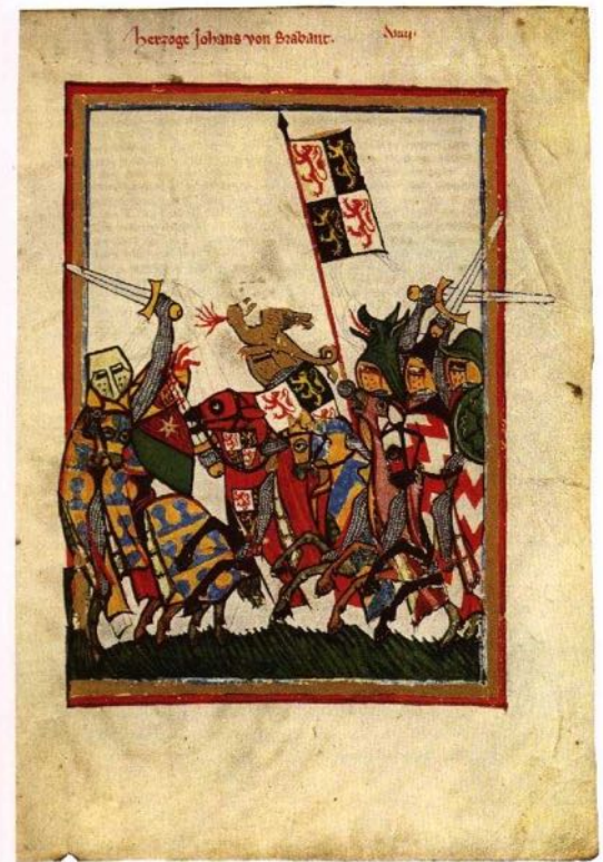
Herzog Johann von Brabant in der Schlacht von Worringen (1288), aus der Heidelberger Liederhandschrift (Codex Manesse), entstanden in Zürich, 1305-1340

gegen die berittenen Landesfeinde wie die Sarazenen , die Awaren und Ungarn . Deshalb schufen die deutschen Kaiser und Könige eine bewegliche, gepanzerte Reiterei, die sich aus Berufskriegern zusammensetzte. Von den Awaren übernahm man die Erfindung des Steigbügels, ohne den eine schwere Reiterei nicht möglich gewesen wäre. Die berittenen Berufskrieger stellte zunächst der Adel. Seit dem 10. Jahrhundert wurden auch Söhne freier Bauern und Ministerialen (Beamte) als Reiter verwendet und von ihren Herren mit einem kleinen Lehen belohnt. Diese wirtschaftliche Besserstellung und der gleiche Dienst zu Pferd verwischten allmählich die Unterschiede der Abstammung. Sie alle, die in schwerer Rüstung als Reiter in den Krieg zogen,