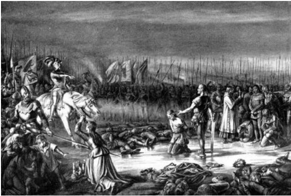
Nach heutigen Begriffen ein Kriegsverbrechen: Die Besetzung von Greifensee hat sich ergeben und wird nun von den Siegern hingerichtet. Der eidgenössische Scharfrichter will „nach altem Brauch“ jeden zehnten Mann verschonen, was der Schwyzer Landamman Ital Reding aber nicht gestattet. (Schulwandbild Ende 19. Jh.)

Verhandlungen ergaben wieder nichts. Die eidgenössisch gesinnten Zürcher, welche vermitteln wollten, wurden in der Stadt hingerichtet. Nun sollte Zürich belagert werden. Zuvor mussten aber die befestigten Plätze rund um die Stadt gebrochen werden. So zogen die Eidgenossen