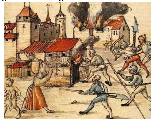
Kleinkrieg vor den Toren der Stadt Zürich. (Zeitgenössische Darstellung)

Der Zürichkrieg schwelte noch fast zwei Jahre lang weiter . Man raubte, brannte und stritt, bis die Eidgenossen im Frühjahr 1446 in einem Kampf bei Ragaz einen Sieg über den österreichischen Adel erfochten, der sie selber 7, den Feind mehr als 700 Mann kostete. Da wurde endlich Friede geschlossen. Zürich musste sein Bündnis mit Österreich auflösen, erhielt aber die meisten Gebiete um die Stadt herum wieder zurück. Das vormals reich besiedelte Züribiet hatte sich in ein Trümmerfeld verwandelt. Die Stadtbevölkerung war von 10 000 auf 5000 gesunken. Tausenden hatte dieser unselige Bürgerkrieg das Leben gekostet. Doch er hat nicht mit dem Auseinanderbrechen des Bundes geendet. Es hatte sich schlussendlich die Einsicht durchgesetzt, dass Solidarität vor Eigennutz stehen musste.