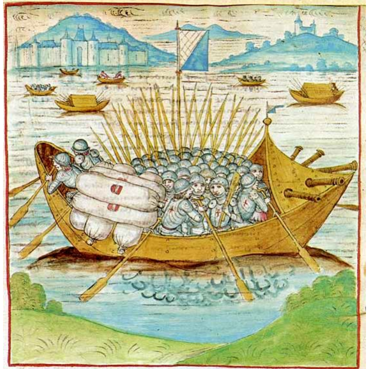
Ein Zürcher „Kriegsschiff“ mit Versorgung aus habsburgischen Beständen für die belagerte Stadt Zürich. An Bord sind österreichische Soldaten. (Zeitgenössische Darstellung).

Die Schwyzer verhungerten nicht, sondern griffen zu den Waffen. Es begann ein Kleinkrieg : Die Zürcher und Schwyzer zündeten einander Dörfer an und verwüsteten die Felder. Schliesslich wurde unter der Aufsicht eines eidgenössischen Schiedsrichters Frieden geschlossen. So hatten die Zürcher nichts vom toggenburgischen Erbe erhalten. Sie mussten sogar noch alten zürcherischen Boden an Schwyz abtreten. Stüssi war wütend. Sein Zorn richtete sich nun auch gegen die Eidgenossen.