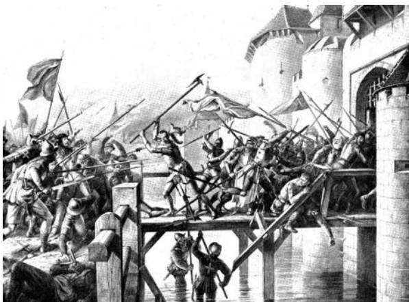
Der verzweifelt kämpfende Bürgermeister Stüssi wird beim Rennwegtor von Eidgenossen erstochen. (Schulwandbild Ende 19. Jh.)

Mit Schadenfreude hatten die Österreicher dem Zwist in der Eidgenossenschaft zugesehen. Wenn die Eidgenossen sich gegenseitig bekämpften, bot sich die Gelegenheit, verlorenes habsburgisches Land zurückzugewinnen. Gern liess sich der habsburgisch-österreichische Herzog Friedrich von den Zürchern zu einem Bündnis bewegen. Nun zogen österreichische Reiter in die Stadt Zürich ein. Friedrich, der eben Deutscher Kaiser geworden war, besuchte die Stadt und wurde mit Jubel empfangen. Die Bürger schworen ihm Treue.