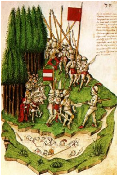
„Schlacht am Morgarten“ - Illustration einer spätmittelalterlichen Chronik.

Jahrhundertlang hat die Weltpolitik die abgelegenen Waldstätten in Ruhe gelassen. Mit der Eröffnung des Gotthardwegs rücken sie jäh in den Fokus der Grossmächte. Die Habsburger möchten hier Einfluss gewinnen - aus militärischen und aus wirtschaftlichen Gründen. Gegen dieses ländergierige Fürstenhaus schliessen die Waldstätten Uri, Schwyz und Unterwalden 1291 einen Bund („Rütlichschwur“).