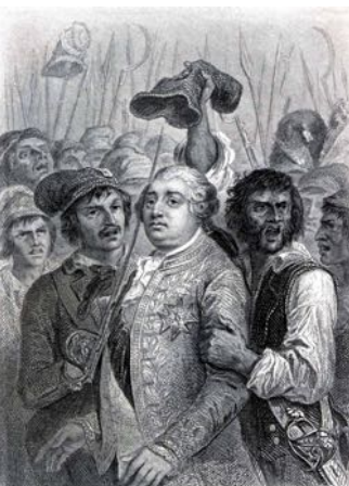
Revolutionäre setzen dem König eine Mütze mit der Kokarde auf.

Am 16. Juli begab sich der König in die Nationalversammlung und versprach dort, gemeinsam mit ihr Ruhe und Ordnung wiederherstellen zu wollen. Dann erschien der König in Paris, wo ihm