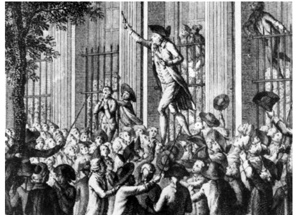
Aux armes, citoyens!

Kokarden zu tragen. Die leidenschaftlichen Aufrufe lösten eine Bewegung aus. Die Menge plünderte Waffengeschäfte und das Zeughaus „Hôtel des Invalides“, wo in der Rüstkammer Kanonen und Gewehre lagerten. Etwa tausend Demonstranten marschierten dann bewaffnet zur Bastille , einer mittelalterlichen Festung, die als Staatsgefängnis diente und als Symbol des Despotismus galt. Die Mauern dieser Burg waren 30 Meter hoch, der Wassergraben 25 Meter breit.