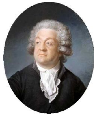
Honoré Gabriel Victor de Riqueti, Marquis de Mirabeau , Abgeordneter und Wortführer des Dritten Standes in den Generalständen. 1790 wurde er Präsident des Jakobinerclubs und hielt 1791 den präsidentalen Vorsitz der Nationalversammlung. Mirabeau starb 1791 vermutlich durch Giftmord.

Die Sturmtruppe bestand hauptsächlich aus Angehörigen der Unterschicht : Handwerker und Arbeiter. Sie wurde durch eine Abteilung der eben gegründeten Bürgerwehr verstärkt, die drei Kanonen vor dem Festungstor in Stellung brachten. Der Kommandant der Bastille, der 30 Schweizer Söldner und 80 Invalide unter seinem Befehl hatte, nahm Verhandlungen auf. Doch da gelang es der Menge, die Zugbrücke herabzulassen und in den Hof einzudringen . Die Verteidiger eröffneten das Feuer, es kam zu Kämpfen, die einige Opfer forderten. Der