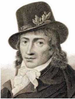
Camille Desmoulins , Advokat und Volksredner. Er nannte sich „Procureur général de la lanterne“. Von den Trümmern der Bastille herab verkündete er Freiheit und Gleichheit.

Redner standen auf den Mauern und geiferten in schrillen Tönen gegen die Aristokraten: „Les aristocrates à la lanterne!“.