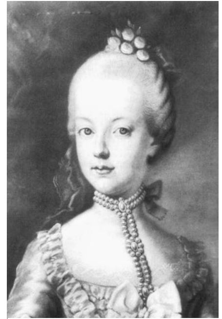
Das Portrait von Marie Antoinette, das der Hof in Wien nach Versailles schickte.

Marie Antoinette bemühte sich, das Beste aus ihrem seltsamen Louis zu machen. Sie gewöhnte ihm seine Gier nach Kuchen und seine unmäßige Leidenschaft für die Jagd ab. Gemeinsam machten sie einen Staatsbesuch in Paris, wo, wie Marie Antoinette an ihre Mutter, die Kaiserin von Österreich, schrieb, „die armen Leute, trotz der drückenden Steuern, außer sich waren vor Freude, uns zu sehen. Was für ein Glück, die Freundschaft eines Volkes so leicht zu gewinnen, obwohl es doch nichts Kostbareres gibt. Das habe ich tief empfunden, und ich will es nie vergessen.“ „Nie“ sagt man leicht, wenn man jung und fröhlich und verwöhnt ist. Marie-Antoinette war leichtsinnig und starrköpfig, aber auch warmherzig und bereit, eine gute Frau und Mutter zu werden.