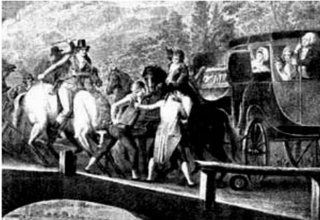
Arrestation de la famille royale à Varennes

Früh am Morgen machten die Belagerer ein paar Wachtposten nieder und drangen ins Schloss ein. Nur halb bekleidet flüchtete Marie Antoinette zum König, während hinter ihr die Horde in ihr Schlafgemach einbrach. Das königliche Paar saß auf einem Diwan,