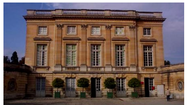
Le Petit Trianon im Garten von Versailles

Das erste Kind des königlichen Paares, 1778 geboren, war ein Mädchen. Als drei Jahre später der erste Sohn zur Welt kam, tanzte das Volk auf den Straßen, und die Menschen jubelten. Zum letzten Male erfreute sich das Königshaus solcher Beliebtheit. Die junge Königin hatte es nicht nur mit dem Adel verdorben. Überall im Land kamen revolutionäre Ideen auf. Die Feindseligkeit der Menschen richtete sich nicht gegen den trägen, freundlichen König, sondern gegen seine