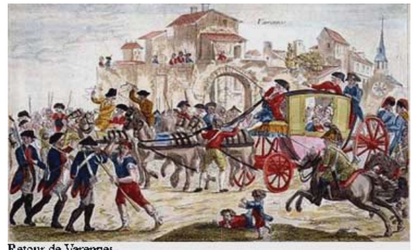
Retour de Varennes.