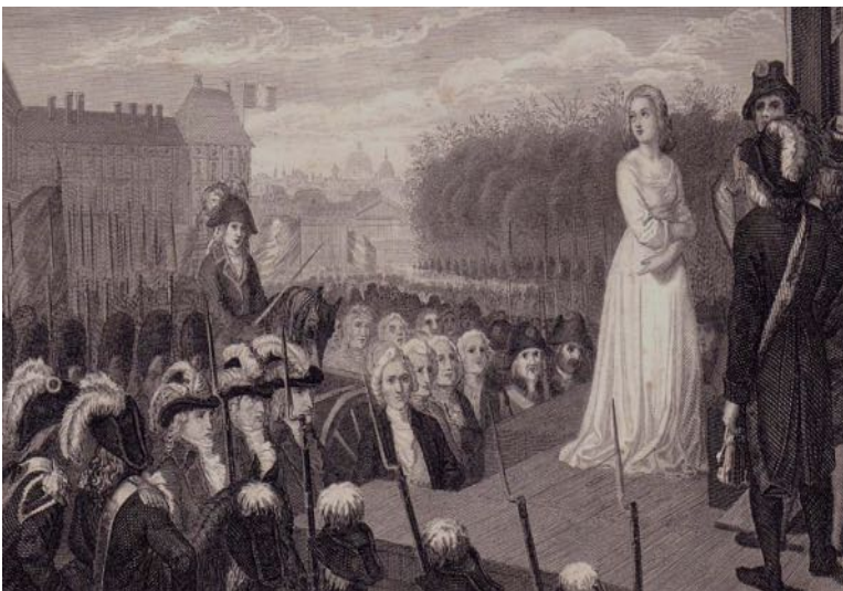
Die Hinrichtung Marie Antoinettes 1793

Nun war sie nicht mehr die Königin Marie Antoinette von Frankreich, sondern die "Witwe Capet", siebenunddreißig Jahre alt, in Trauer gekleidet, weißhaarig, abgezehrt, niedergedrückt von Schmerzen. Der nächste Schlag traf sie, als man ihr den Dauphin, ihren zweiten Sohn, wegnahm. Von ihrem Verlies aus konnte sie hören, wie seine Kerkermeister ihm beibrachten, seine Eltern und Gott zu verfluchen. Sie hatte schon soviel geweint, dass ihr keine Tränen mehr blieben, als sie in die Conciergerie, das finsterste Gefängnis in Paris, überführt wurde.