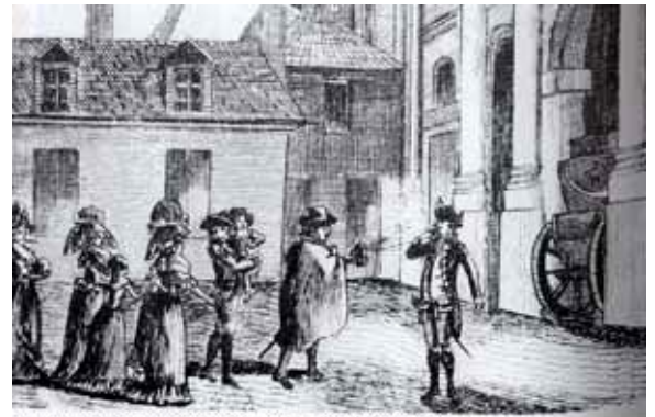
Fersen prépare la fuite de la famille royale.

An diesem milden, klaren Oktobertag musste die königliche Familie Trianon für immer verlassen. Sie wurde in den Tuileries, dem grimmigen, alten Palast in Paris, untergebracht. Hier lebte sie bange Monate in einem Zustand, der einer Haft nahe kam. Anfang Juni jedoch wurde es klar, dass keine andere Rettung blieb als die Flucht.