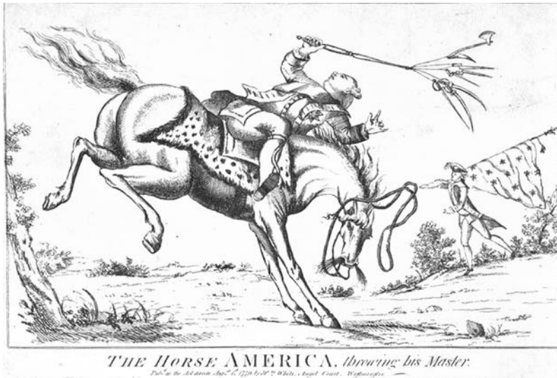
Das Pferd „Amerika“ wirft seinen Herrn (den englischen König Georg III.) ab. Beachte die Reitgerte! Im Hintergrund ein „Patriot“ mit der neuen Flagge.

Die ersten Siedler in Nordamerika im 16. und 17. Jahrhundert sind im Süden der Ostküste hauptsächlich Spanier, in nördlicheren Gebieten Franzosen, Holländer und Engländer. Politisch bilden sich, da die Engländer seit ihrem Sieg über die spanische Armada im