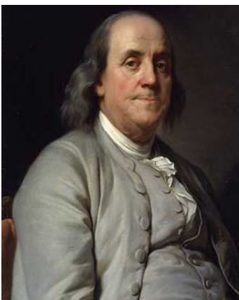
Benjamin Franklin, (1706-90) Drucker, Verleger, Autor, Naturwissenschaftler, Erfinder und Staatsmann.

Benjamin Franklin war ein unternehmungslustiger, praktischer Amerikaner, der alles verstand und alles konnte. Er verwaltete die Feuerwehr und die Post, sorgte in Philadelphia für die Einführung der Straßenbeleuchtung und Straßenpflasterung, gab Zeitungen heraus, schrieb Bücher und erfand den Blitzableiter. Er prägte die Losungen: „Time is money“, „Well done is better than well said“ und „Mine is better than ours“. Dieser Franklin ging als erster amerikanische Gesandter nach Paris und brachte Bündnisse mit Frankreich und Spanien zustande - Frankreich wollte sich für seine Verluste im Kolonialkrieg an England rächen. Bald kämpfte der französische General Lafayette an der Spitze französischer Truppen Seite an Seite mit General Washington.