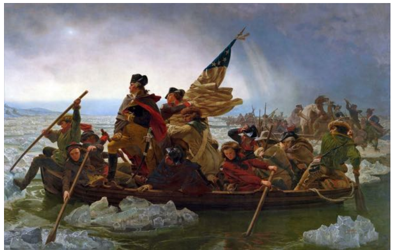
„ Washington crossing the Delaware “. General George Washington überquert den Fluss Delaware in der Nacht vom 25. auf den 26. Dezember 1776 für einen Überraschungsangriff gegen die hessischen Einheiten in Trenton, New Jersey.

George Washington hatte wenig Truppen, kaum Kriegsmaterial, kein Geld und karge Verpflegung. Vorteil für die Kolonisten (die Amerikaner, die „ Patrioten “) war, dass sie im unwegsamen Gelände nicht wie die Briten in geschlossener Marschordnung kämpften, sondern aus dem Hinterhalt. Entscheidende Siege konnten sie aber erst erreichen, als ihnen die französische Regierung half. Der König von Frankreich, Ludwig XVI., sah nämlich in den Kolonisten „Feinde seiner Feinde“ (der Engländer) und unterstützte sie deshalb mit Kriegsmaterial und Soldaten.