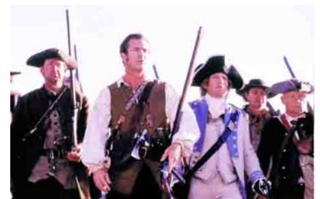
Aus dem Film „The Patriot“

London antwortete auf diese Unabhängigkeitserklärung damit, dass es noch mehr Truppen nach Nordamerika sandte: 10 000 britische Soldaten und 30 000 in Deutschland angeworbene Söldner (die Hessen) . Die Briten zielten darauf ab, die Neuenglandstaaten von den anderen Kolonien zu isolieren, um die Rebellenarmee rasch zu zerschlagen. Britische Verbände landeten auf der New York vorgelagerten Insel Staten Island und griffen von dort aus die Stadt an.