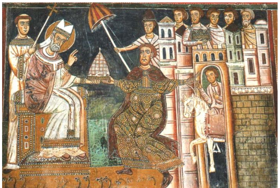
Fresko: Konstantin überreicht Silvester die Papstkrone und übergibt ihm den Lateran, den offiziellen Sitz des Papstes in Rom. Silvester war der erste Papst, der nicht den Märtyrertod sterben musste.

Auch seine Nachfolger bekämpften das Christentum, bis Kaiser Galerius kurz vor seinem Tod im Jahre 311 ein Toleranzedikt erließ, mit dem er der Christenverfolgung ein Ende setzen wollte. Dies gelang zwar nicht ganz, doch es war ein erster Schritt zur Staatsreligion / Religionsfreiheit .