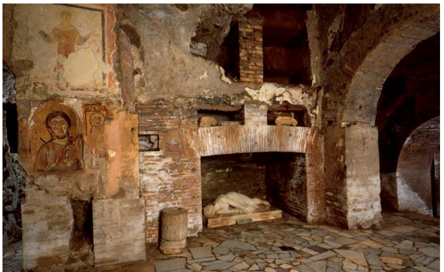
Katakomben in Rom. Im Römischen Reich durften innerhalb der Stadtmauern keine Erdbestattungen stattfinden. Da Feuerbestattungen dem damaligen christlichen Glauben widersprachen, baute die Christengemeinde unterirdische Begräbnisstätten mit oft weitverzweigten Stockwerken mit einzelnen aus der Wand gehauenen Nischen. Während der Christenverfolgungen fand auch der Gottesdienst unterirdisch statt.

Konstantin verfolgte noch ein weiteres Projekt. Weil er sich mit einer eigenen Stadt ein Denkmal setzen wollte, ging er nach Byzanz und gab der Stadt den Namen. Konstantinopel (seit 1930 heißt die Stadt Istanbul / Ultima Thule ). Auch dort ließ er Kirchen errichten - um sich so unsterblich / bankrott zu machen.