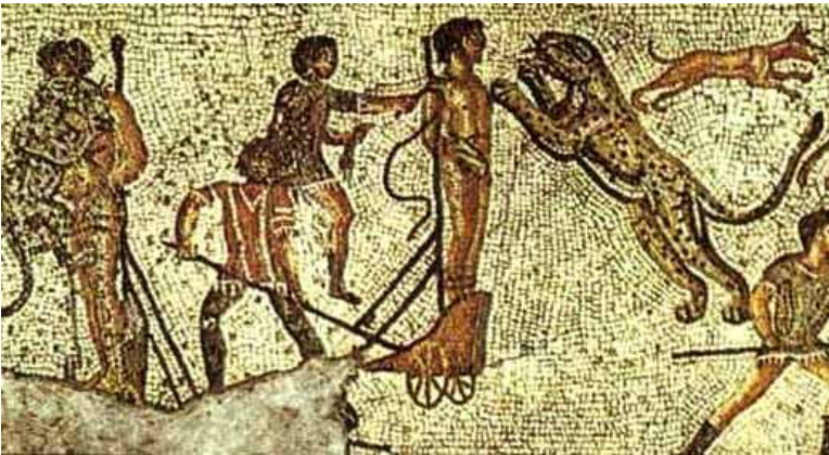
Christen werden im Amphitheater wilden Tieren zum Fraß vorgeworfen - zeitgenössisches Mosaik

Spätestens im 3. Jahrhundert wurde das Christentum im Römischen Reich zu einer Massenbewegung / vorübergehenden Modeerscheinung .