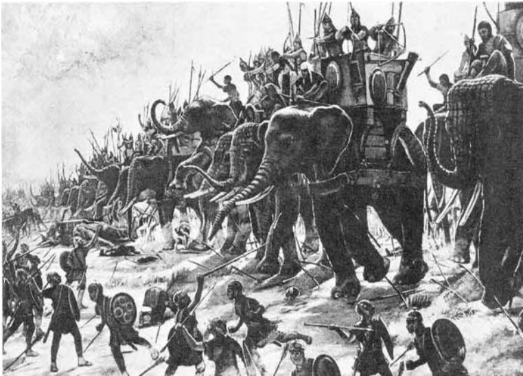
Die Schlacht von Zama (Nordafrika) 202 v.Chr.

Als Hannibal in Karthago eintraf, war es eine Heimkehr nach Jahrzehnten. Er war neun Jahre alt gewesen, als er seine Heimatstadt zuletzt gesehen hatte. Er galt nach wie vor als einer der fähigsten Feldherren aller Zeiten , und er wurde entsprechend als Held empfangen. Er erhielt