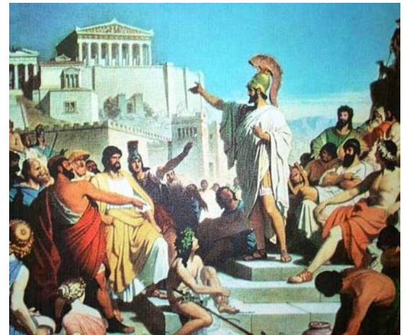
Volksversammlung in Athen. In Griechenland wurde die Demokratie erfunden.

Regen Handel blühte und die griechischen Schiffe befuhren das ganze Mittelmeer. In Griechenland selber bildete sich kein einheitlicher Staat . Das durch die Gebirge in viele Teile gesplante Land