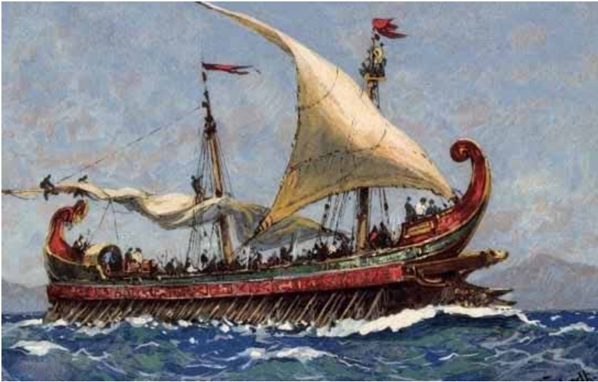
Attische Triere (Kriegsschiff)

Nach den Perserkriegen gründete Athen, gestützt von seiner mächtigen Flotte, einen Bund von