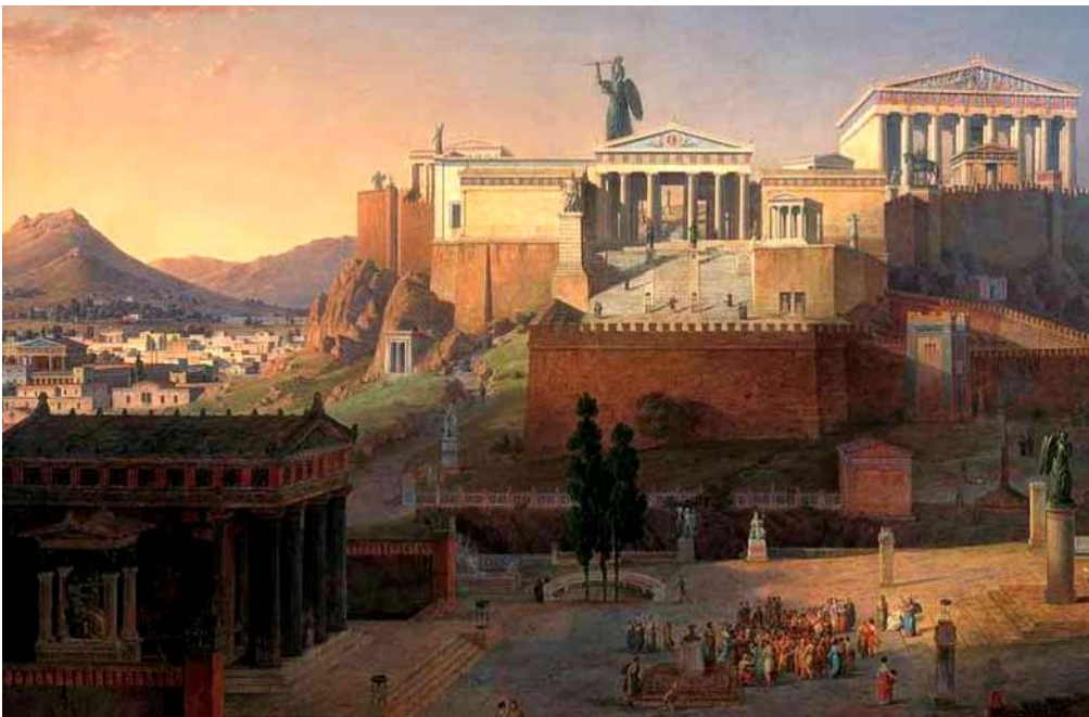
So könnte die Akropolis („Oberstadt“) von Athen vor 2500 Jahren ausgesehen haben.

Die Athener lebten dem Meer zugewendet. Da ihr Boden karg und rau war, konnten sie ihren Unterhalt nicht in der Landwirtschaft finden. Sie kamen als Seefahrer- und Handelsvolk zu ihrem Reichtum. Athen war nicht wie Sparta von Königen beherrscht. In Athen regierte das Volk ( Demokratie ). Die Kaufleute konnten ihre Anliegen in die Staatsführung einbringen.