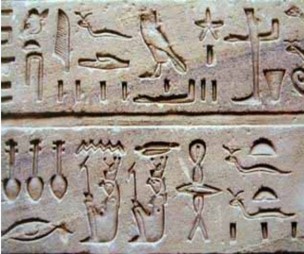
Ägyptische Hieroglyphen

Weil der Nilschlamm in jedem Jahr die Ackergrößen verdeckte, mussten die Grenzsteine häufig ausgebuddelt / die Äcker immer wieder neu vermessen werden. Dies förderte nicht nur das soziale Verhalten der Menschen in Ägypten, sondern machte sie auch aggressiv / zu Mathematikern und Naturforschern . Die Menschen in Ägypten lernten sehr früh, Flächen (Dreieck, Rechteck) zu berechnen.