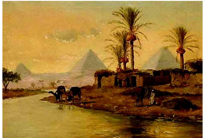
„Am Nil“ - Gemälde aus dem 19. Jh.

Es ist die Zeit, da die Menschen nördlich der Alpen in einfachen Holzhütten wohnen und gerade lernen, den Acker zu bestellen. Da lebt im Niltal bereits das Volk der Ägypter in einem geordneten Staat. Ihre Äcker bringen reiche Ernten, für eventuelle Missernten legen sie Vorräte an. Wissenschaft und Baukunst stehen in Blüte. Es gibt schon Städte mit Tausenden von Einwohnern. Das Land wird vom Pharao regiert. Die Pyramiden, die Grabstätten der Pharaonen, gehören zu den 7 Weltwundern der Antike.