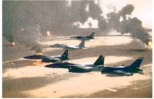
Brennende Ölquellen in Kuwait. Der Krieg verursacht große Umweltschäden.

Im August 1990 besetzt der irakische Diktator Saddam Hussein den reichen Ölstaat Kuwait militärisch und erklärt ihn zur irakischen Provinz. Die Annexion stößt auf Widerstand der Vereinten Nationen. Da die Zeit des Kalten Krieges vorbei ist, kommt ein Bündnis von 32 Staaten gegen den Irak zustande. Als Hussein ein letztes Ultimatum zum Rückzug unbeachtet lässt, bricht im Januar 1991 der Golfkrieg aus. Saddam Hussein versucht, die Krise zu einer weltweiten Krise zu machen. Es soll eine Verknüpfung zwischen diesem Konflikt und den von Israel besetzten Gebieten hergestellt werden. Doch Saddam Hussein scheitert.