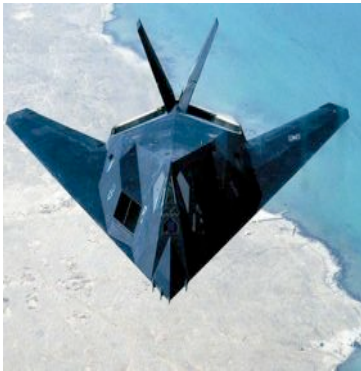
Stealth. Tarnkappenbomber haben eine spezielle Form und werden so vom Radar nicht erfasst.

30 Länder entsandten eine gemeinsame Interventionsarmee von 700 000 Soldaten, darunter 420 000 Amerikaner. Der „Desert Storm“ begann mit massiven Luftangriffen. 39 Tage lang ging auf irakische Ziele ein Hagel von Raketen und