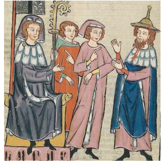
Darstellung aus dem 14. Jh. Der Minnesänger Süßkind von Trimberg trägt seine Gedichte am Hof vor. Als Jude wird er mit dem damals typischen Judenhut dargestellt. Diese Art Hut war bei den Juden im Mittelalter Mode, wurde aber teilweise von der Obrigkeit auch vorgeschrieben.

Im Jahr 1095 rief der Papst auf der Synode von Clermont in einer Predigt zum Ersten Kreuzzug auf, um die „Feinde des Christentums“ aus dem Heiligen Land zu vertreiben und zum Heiligen Grab Christi zu pilgern. Die einzelnen Teilnehmer konnten damit ihre Sünden abbüßen. In allen europäischen Städten erscheinen Wanderprediger , die dafür sorgten, dass neben den Rittern auch viele einfache Menschen, Abenteurer, Verbrecher, aber auch Bauern in den Krieg zogen. Da die Juden wie die Muslime als Feinde des Christentums galten, wurden sie in die Hasspredigten einbezogen. So kamen viele Ausziehende auf die Idee, vor der Reise nach Jerusalem auch die eigenen Territorien zu „säubern“ und ihren Mut an wehrlosen Juden zu beweisen.