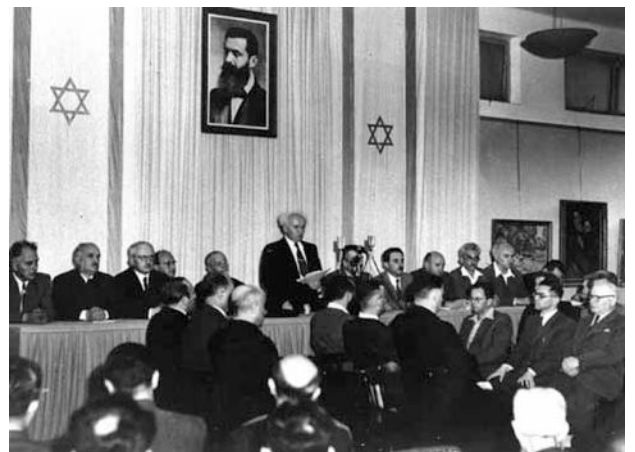
Tel Aviv, Mai 1948: Unter dem Porträt von Theodor Herzl proklamiert David Ben Gurion die Republik Israel.

Mitten in den gewalttätigen Angriffen, die seit Monaten auf uns unternommen werden, appellieren wir an die in Israel lebenden Angehörigen des arabischen Volkes, den Frieden zu wahren und sich auf der Grundlage voller bürgerlicher Gleichberechtigung am Aufbau unseres Staates zu beteiligen.