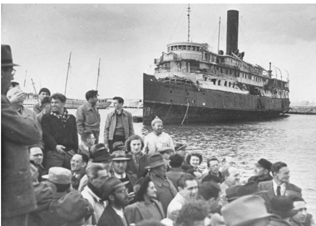
1948 an der Küste des eben gegründeten Israels: Jüdische Immigranten aus Europa, die dem Holocaust entronnen sind.

Der Antisemitismus, der in der zweiten Hälfte des 19. Jh. durch die entstehenden Nationalstaaten zunimmt, gipfelt dann in den 1930er-Jahren im Rassenwahn der Nationalsozialisten, die zwischen 1933 und 1945 fünf Millionen Juden ermorden.