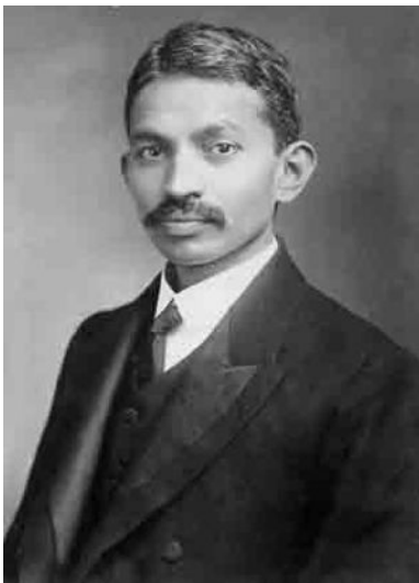
Gandhi 1906 in Südafrika

Der Junge wurde durch den Glauben geprägt. Er lebte strikt ohne Gewalt, war Vegetarier und trank keinen Alkohol. Als Dreizehnjähriger wurde er standesgemäß verheiratet. Im Laufe der Ehe kamen vier Kinder auf die Welt. Gandhi schloss die Schule mit großem Erfolg ab entschied sich dann für ein Jurastudium in England. Seiner skeptischen Mutter versprach er, den Hinduismus in London weiterzuleben und sich nicht der „unmoralischen“ westlichen Lebensart anzupassen. Eine Versammlung seiner Kaste in seinem Heimatort entschied, Gandhi aus der Kaste auszuschließen. Kastenlose wurden innerhalb der hinduistischen Gesellschaft nicht akzeptiert.