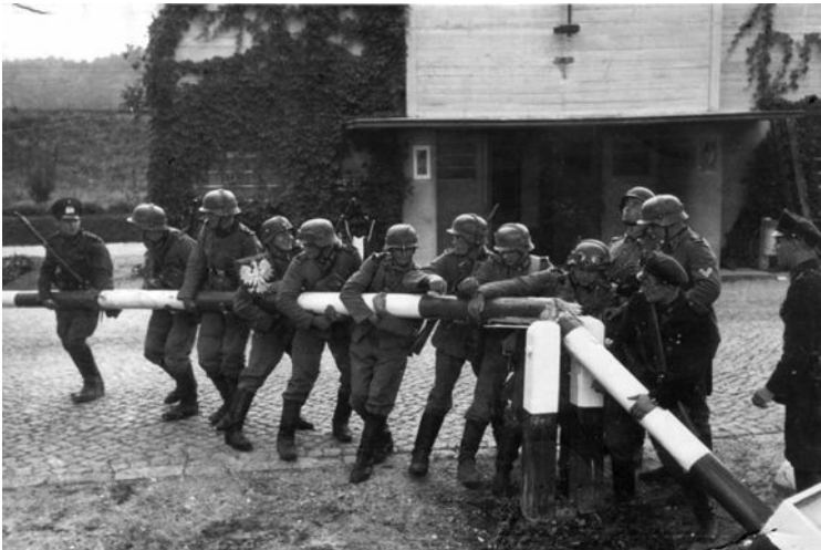
Der Beginn des 2. Weltkriegs im September 1939: Deutsche Soldaten entfernen einen Schlagbaum an der Grenze zu Polen.

Von den zwei Möglichkeiten ist jeweils eine unrichtig. Streich diese: