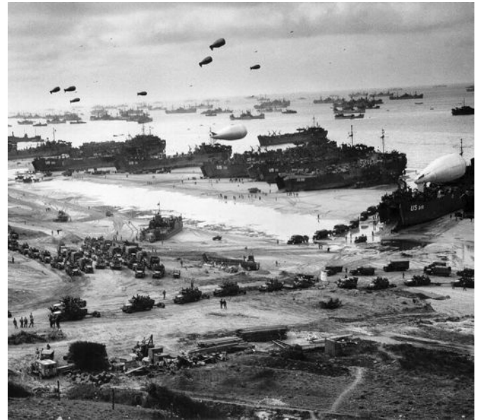
Normandie, Omaha Beach. Materialnachschub für die Invasionstruppen.

Zur Entlastung der Roten Armee hatte Stalin seine Bündnispartner gedrängt, in Europa eine zweite Front aufzubauen. Die Konferenz von Teheran im November 1943 beschloss Landungen in Nord- und Südfrankreich. An den Landungen an der nordfranzösischen Küste nahmen Truppen aus dem Vereinigten Königreich, den Vereinigten Staaten, Polen, Frankreich, Neuseeland, Kanada und vielen weiteren Nationen teil. Gleichzeitig wurde die größte Landungsflotte des Krieges für die Überfahrt, Landungen und Nachschubversorgung zusammengezogen sowie eine große Anzahl von Flugzeugen bereitgestellt.