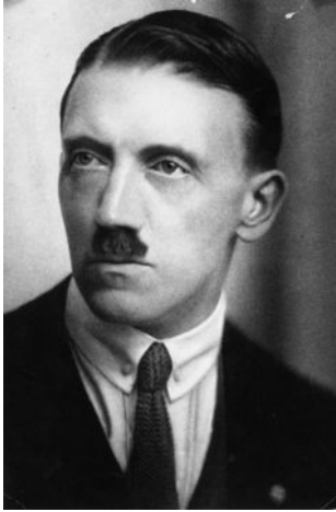
Der Agitator Hitler um 1920

Adolf Hitler wurde 1889 in der schweizerischen / österreichischen Stadt Braunau am Inn geboren. Der Vater war Zollbeamter und musste aus beruflichen Gründen oft umziehen.