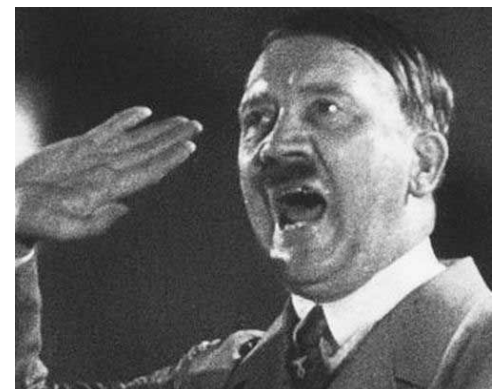
Hitler als Demagoge

Leseprobe aus „Mein Kampf“: (Der Gefreite Hitler erlebt das Kriegsende und die Revolution von 1918/19 und kommentiert die Ereignisse) „Kaiser Wilhelm II. hatte... den Führern des Marxismus die Hand zur Versöhnung gereicht, ohne zu ahnen, dass Schurken keine Ehre besitzen. Während sie die kaiserliche Hand noch in der ihren hielten, suchte die andere schon nach dem Dolche. Mit dem Juden gibt es kein Paktieren, sondern nur das harte Entweder - Oder. Ich aber beschloss, Politiker zu werden“.