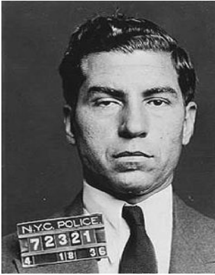
Der legendäre Charles „Lucky“ Luciano (1897-1962) war Padrone der Cosa Nostra in New York.

Die Mafia entsteht im Sizilien des 18. Jahrhunderts als Selbstschutzorganisation gegen Obrigkeitwillkür. Mit der Zeit wandelt sich der Geheimbund in eine regelrechte Subkultur. Zunächst zeichnen sich die Mitglieder dieser „Ehrenwerten Gesellschaft“, wie sie sich selber nennen, durch ein bestimmtes Sozialverhalten aus. „Omertà“ (Schweigen) und „Vendetta“ (Rache) bestimmen das Zusammenleben in der Mafia und das Auftreten gegen außen. Die Mafia-„Familien“ nutzen ihre sich entfaltende Macht zur illegalen Bereicherung.