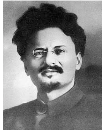
Leo Trotzki. Eine zentrale Figur der Russischen Revolution.

Im politischen Machtkampf nach Lenins Tod unterliegt er Stalin und wird 1929 des Landes verwiesen. Während Stalin zuerst den Kommunismus in Russland festigen und erst dann in die Welt ausweiten will, strebt Trotzki die permanente internationale Revolution an, welche ein weltweites kommunistisches Arbeiterparadies schaffen soll. Zuletzt lebt Trotzki, einst neben Lenin der mächtigste Mann der Sowjetunion, in Mexiko, wo er 1940 durch einen Agenten Stalins ermordet wird.