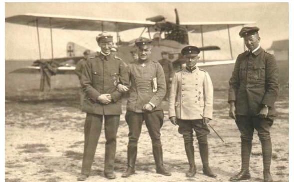
Die Jagdflieger sahen sich als „ Ritter der Lüfte “ und wurden in der Heimat gefeiert wie heute die Spitzensportler, während Hunderttausende von Soldaten in anonymen Massengräbern verscharrt wurden (1917 hatte die Heeresleitung sogar das Tragen von Trauerkleidern für die Angehörigen verboten). In Wirklichkeit war der Luftkampf kaum ein heldenhafter Zweikampf, sondern ein brutales und heimtückisches Morden. Der zweite von links ist der berühmteberühmte Freiherr Manfred von Richthofen, der „Rote Baron“ (Juni 1917).

Flugzeuge waren mit zwei Motoren ausgerüstet, schneller als die Jagdflieger und konnten auf über 5000 Meter hoch steigen. Bei einem Terrorangriff deutscher „Gothas“ auf London fanden mehr als 500 Menschen den Tod. Das war der Beginn des Krieges gegen die Zivilbevölkerung , der im dann im Zweiten Weltkrieg einen furchtbaren Höhepunkt erlebte.