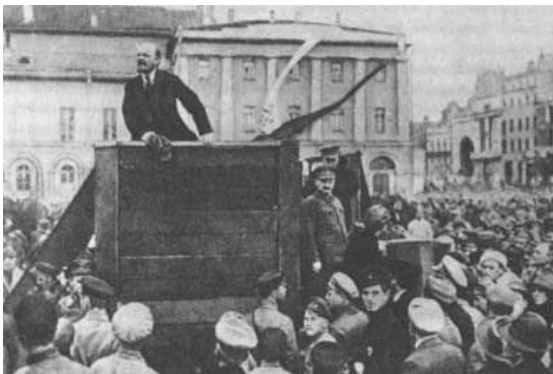
Lenin in Petrograd. Oktober 1917.

Die Regierung in Berlin wusste, dass in Zürich ein Berufsrevolutionär auf den geeigneten Augenblick wartete, die kommunistische Revolution in Russland zu entfachen. Diesem Lenin gestattete man jetzt, zwei