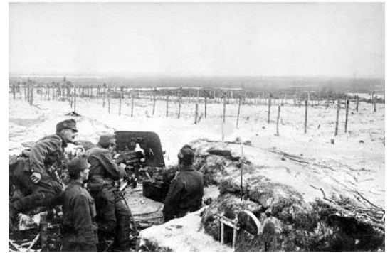
Österreichisch-ungarisches Militär an der Ostfront

Im März musste Zar Nikolaus II. abdanken. Die neue bürgerliche Regierung wollte zwar Reformen einführen, doch den Krieg weiterführen. Aber das Russische Reich war im Einsturz begriffen. Die deutsche Heeresleitung sah das gerne. Ein im Chaos versinkendes Russland konnte kaum mehr Krieg führen.