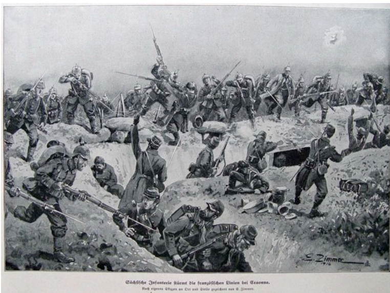
Österreichische Infanterie kämpft die französischen Chines bei Comme. Nach eigenen Schildern an Ort und Stelle gezeichnet von H. Zimmer.

An der russisch-österreichischen Front siegten dagegen die Russen . Sie besetzten Galizien, überstiegen von dorthier die Karpaten und gelangten bis an den Rand der Ungarischen Tiefebene.