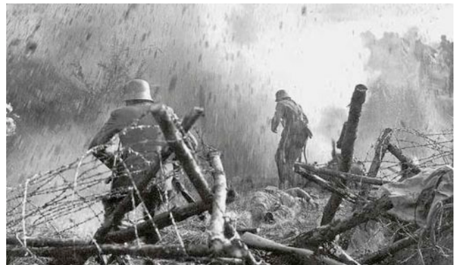
Deutsche Soldaten im Feuer der französischen Artillerie.

Schneller als erwartet waren inzwischen die Russen in Ostpreußen eingedrungen. Bei Tannenberg verloren sie 50 000 Tote und 90 000 Gefangene, und an den Masurischen Seen wurde der größte Teil ihres Heeres ertränkt. Der siebenundsechzigjährige General von Hindenburg stieg über diese Siege an der Ostfront zum vergötterten deutschen Helden empor, der den Endsieg verbürgte.