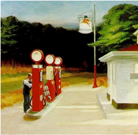
Eine Tankstelle in den USA um 1940 (Ausschnitt aus einem Gemälde von Edward Hopper).

Präsident Theodore Roosevelt hatte in seinem Wahlkampf versprochen, gegen die schädliche