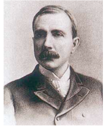
John D. Rockefeller, der „Petroleumkönig“ (um 1875)

Als Petrollampen aufkommen, ist John D. Rockefeller noch ein Junge. Infolge der großen Nachfrage nach Petroleum versiegen die da und dort an der Oberfläche vorhandenen Ölpfützen rasch. Man beginnt nach Erdöl zu bohren. Im Jahr 1859 wird im Staat Pennsylvanien der erste Bohrturm aufgestellt. Nun ist John D. zwanzig Jahre alt. Sein Vater ist verschwunden (er lebt als Bigamist in einem andern Staat).