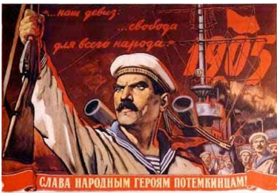
Filmplakat von 1925

So nahm der Panzerkreuzer Kurs auf die Küste Rumäniens, um dort Unterstützung zu finden - eine trügerische Hoffnung. Am 8. Juli 1905, zwölf Tage nach Beginn der Meuterei, musste sich die Besatzung der „Potemkin“ den rumänischen Behörden ergeben. Die Matrosen wurden der russischen Regierung ausgeliefert, die einen Teil der Mannschaft zum Tode verurteilte und