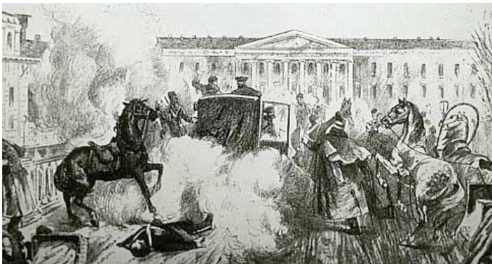
1881 starb Zar Alexander II. bei einem Bombenanschlag der revolutionären Gruppe «Narodnaja Wolja» («Volkswille»). Zuvor hatte er bereits fünf Attentate überlebt.

1836 zählte man neben viereinhalb Millionen Handwerkern, Kaufleuten, Beamten und Geistlichen fünfundvierzig Millionen Bauern. Das waren Leibeigene adeliger Großgrundbesitzer. Meist war ihnen ein kleines Stück Land zugeteilt für den eigenen Bedarf, daneben mussten sie auf dem Herrngut Frondienst leisten. Der Gutsverwalter durfte sie auspeitschen. Sie wurden mitsamt Hausrat und Vieh versteigert. Widerspenstige verschickte man zur Zwangsarbeit nach Sibirien. Wo Industrie war, verpachtete der Gutsherr seine Leute den Fabrikbesitzern.