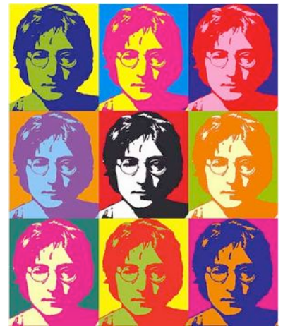
Pop-Art: Das Portrait des Ex-Beatles John Lennon in verschiedenen Farbvariationen, von Andy Warhol (oder seinen Mitarbeitern)

In den 1950er-Jahren aber beginnen in den USA und in England junge Künstler wieder gegenständliche Bilder zu malen. Die neue Kunstrichtung wird Pop-Art genannt. Sie zeigt vor allem Dinge der Alltags- und Massenkultur, des Konsums, der Werbung und der Jugendkultur. Roy Lichtenstein malt einzelne Comicbilder nach - in riesengroßem Format. Andy Warhol reproduziert sowohl farbig verfremdete Fotos von Stars wie Marilyn Monroe oder Elvis Presley wie auch von Suppendosen oder Dollarscheinen. Pop-Art zeigt sich als ironischer Spiegel unserer Konsum- und Mediengesellschaft.