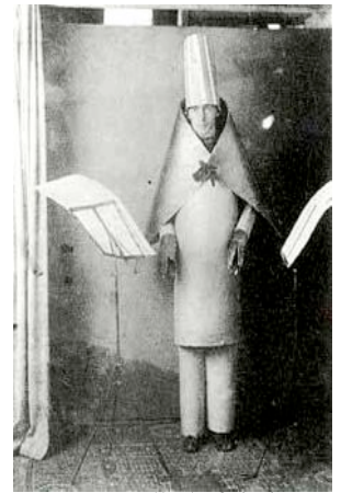
Hugo Balls Auftritt im Cabaret Voltaire 1916

Im Cabaret Voltaire in Zürich wurden Abendveranstaltungen mit Tanz, Lesungen und Ausstellungen abgehalten. Hier versammelten sich im Februar 1916 einige Künstler, die eine Anti-Kunst schufen , die sich gegen die verlogenen Ideale und Werte einer Gesellschaft richtete, die den Krieg herbeigeführt und ermöglicht hatte. Dada verhöhnzte die herkömmlichen Kunstformen und den guten Geschmack.