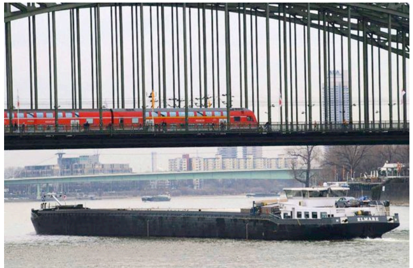
Der RHEIN entspringt in Graubünden (Schweiz), wendet sich bei Basel Richtung Norden - hier durchfließt er KÖLN - und mündet 1233 km nach der Quelle bei Rotterdam in die Nordsee