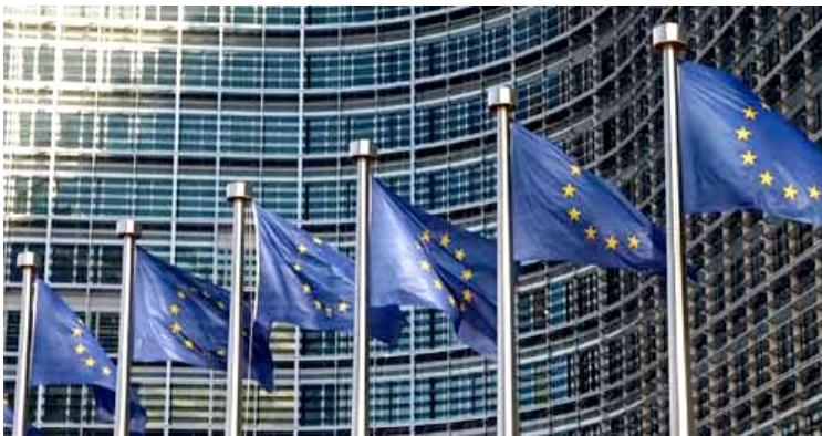
BRÜSSEL, Büros der EU-Kommission

46 souveräne Staaten liegen ganz oder teilweise in Europa. Umstritten ist die Republik Kosovo, die für die Hälfte der UNO-Mitgliedstaaten nicht ein eigenständiger Staat, sondern eine abtrünnige ..... ist und als serbisches Territorium gilt. 1950 hatten sechs europäische Staaten dem Plan des französischen Außenministers Schumann zugestimmt, einen gemeinsamen Markt für Kohle und Stahl zu bilden. Diese ..... war der Grundstein der heutigen EU. Unter der Leitung des Belgiers Paul-Henri Spaak wurden zur Fortsetzung der europäischen Integration neue Verträge ausgearbeitet und in Rom unterzeichnet. Diese Römischen Verträge waren zugleich die Gründung der Europäischen