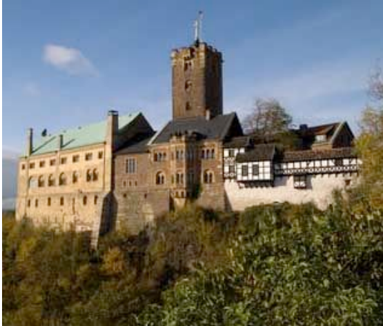
Die Wartburg über der Stadt Eisenach in Thüringen

Luther wurde 1520 vom Papst zum Kardinal ernannt / gebannt . Als Antwort verbrannte er die Bulle / Stulle . Auch vor dem Kaiser am Karneval zu / Reichstag in Worms lehnte Luther jeglichen Widerruf / jegliche Kritik an seiner Lehre ab. Da verhängte der Kaiser die Reichsacht über Luther. Heimlich ließ ihn Kurfürst Friedrich von Sachsen auf den Trabant / die Wartburg bringen. Dort begann Luther mit der Übersetzung des neuen Testaments. Er übersetzte nicht wörtlich, sondern versuchte, biblische Aussagen mystisch zu verfremden / nach ihrem Wortsinn ins Deutsche zu übertragen . Er wollte „ dem Volk aufs Maul schauen “ / „ den Leser verprügeln “ und verwendete daher eine kräftige, bilderreiche, volksdümliche / volkstümliche und allgemein verständliche Ausdrucksweise. Durch seine Bibelübersetzung