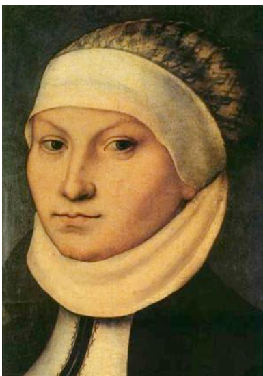
Katharina von Bora (zeitgenössisches Porträt)

1524 gab Luther seine Lebensform als Mönch auf. Ab 1525 hielt Luther die Messe nicht mehr auf Hebräisch / Lateinisch , sondern auf Deutsch. Dann veröffentlichte Luther eine Gottesdienstordnung, die zuerst in Wittenberg, später in allen protestantischen Gebieten üblich / verboten wurde.