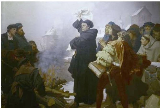
Martin Luther verbrennt die päpstliche Bannbulle.

Im Spätsommer 1511 reiste Luther zusammen mit einem Mitbruder nach Rom. Dort erklimmte er auf Knien die Kletterwand am Petersdom / „Heilige Treppe“ am Lateran (damals Sitz des Papstes) , um Sündenvergebung für sich zu erlangen und seine verstorbenen Verwandten aus dem Fegfeuer / Kerker zu befreien. Er zweifelte also damals noch nicht an der kirchlichen / behördlichen Buß- und Ablasspraxis. Er war gleichwohl schon entsetzt über Law and Order / Unernst und Sittenverfall , die ihm in Rom begegneten.