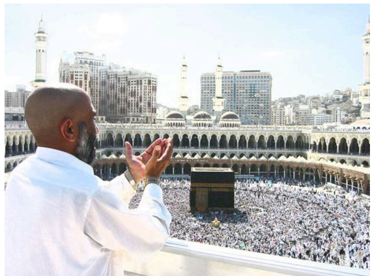
Die Kaaba in Mekka nach dem Freitagsgebet.

Die meisten Bewohner Jathribs werden muslimisch. Mohammed ist ihr Anführer. Die Oase heißt nun Medina, nämlich „Stadt des Propheten“. Im Jahr 630 marschiert Mohammed mit 10 000 Männern in seine Heimatstadt Mekka ein. Hier steht die Kaaba, das würfelförmige Gebäude, worin die arabischen Einwohner ihre Götzen verehren. Der Prophet zerstört die Götzenbilder und weihet das Gebäude Allah. Seither ist die Kaaba das wichtigste Heiligtum des Islam. Viele Mekkaner treten nun dem Islam bei. Als der Prophet stirbt, bleibt seine Lehre erhalten, denn viele Anhänger haben auf Pergament, Lederresten und gebleichten Knochenstücken notiert, was ihnen Mohammed als Wort Gottes überliefert hat. Später wird all dies in einem Buch zusammengefasst: dem Koran.