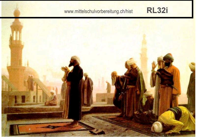
„DAS GEBET“ (1865) GEMÄLDE VON J.-L. GÉRÔME

Die wichtigsten Glaubenssätze des Islams sind in einem Lehrbuch, dem Koran, festgehalten. Der Islam kennt nur einen einzigen Gott: Allah, den Allmächtigen, der die Schicksale aller Menschen schon im Voraus bestimmt hat. Gegen den Willen Allahs ist der Mensch machtlos.