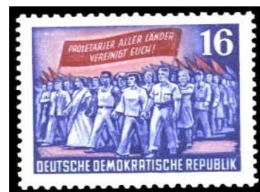
DDR-Briefmarke von 1953