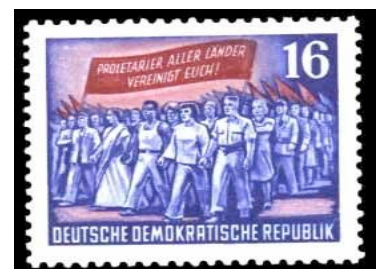
DDR-Briefmarke von 1953