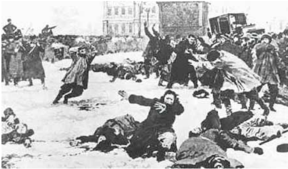
Die Büttel der herrschenden Klasse gehen gegen die Arbeiterschaft vor (Blutiger Sonntag von Sankt Petersburg, Januar 1905)

Die aus dem Untergang der feudalen Gesellschaft hervorgegangene moderne bürgerliche Gesellschaft hat die Klassengegensätze nicht aufgehoben. Sie hat nur neue Klassen, neue Bedingungen der Unterdrückung, neue Gestaltungen des Kampfes an Stelle der alten gesetzt. Unsere Epoche, die Epoche der Bourgeoisie, zeichnet sich jedoch dadurch aus, dass sie die Klassengegensätze vereinfacht hat. Die ganze Gesellschaft spaltet sich mehr und mehr in zwei große feindliche Lager, in zwei große, einander direkt gegenüberliegende Klassen: Bourgeoisie