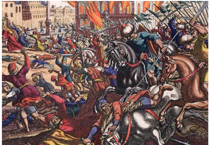
Die Eroberung Konstantinopels durch die Türken 1453 war das Ende des Oströmischen Reiches. Kupferstich von Matthaeus Merian d.Ä. (1593-1650)

Die byzantinische Kunst wurde aus dem Westen und aus dem Osten beeinflusst. Byzanz seinerseits beeinflusste den Westen. Uns ist ein großer Teil der antiken Literatur dank byzantinischen Schriftstellern überliefert.