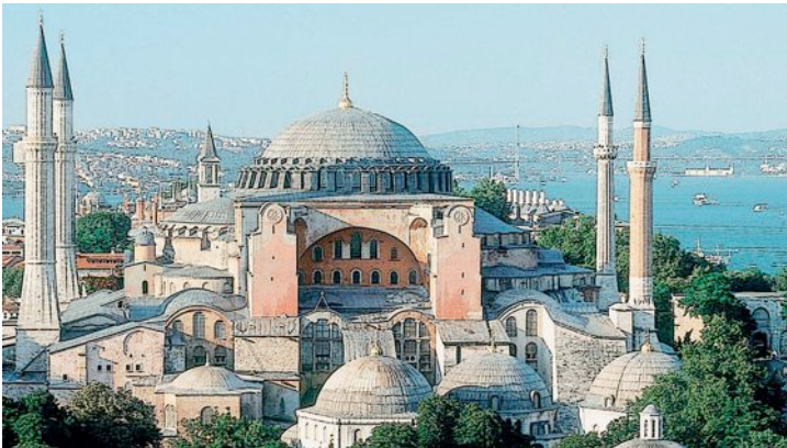
Die Kuppelbasilika „Hagia Sophia“ (Heilige Weisheit) war das Zentrum der orthodoxen Kirche, wurde 1453 zur Moschee und ist heute ein Museum und das Wahrzeichen von Istanbul.

Konstantinopel beherrscht lange Zeit den Mittelmeerhandel und gewinnt ungeheure Reichtümer. Erst ein Jahrtausend nach dem Untergang Westroms verfällt auch das Byzantinische Reich. Nachdem es sich jahrhundertlang gegen islamische Völker behauptet hat, erliegt es 1453 dem Ansturm der Türken.