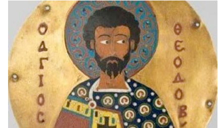
Hl. Theodor auf einer Gürtelschnalle aus Byzanz, 12. Jh.

- auf die Trennung des christlichen Glaubens von der mosaisch-jüdischen Religion in der Antike.