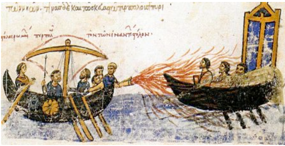
Das Griechische Feuer im Einsatz vor Konstantinopel, zeitgenössische Darstellung

Um 678 war es zu einer ersten Belagerung Konstantinopels durch die Araber gekommen, die aber durch den Einsatz des sogenannten Griechischen Feuers, das sogar auf dem Wasser brannte, zurückgeschlagen werden konnten.