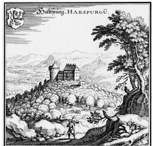
Die Habsburg im Aargau (CH) - Ansicht von 1642. Damals gab es in der Schweiz keine Habsburger mehr. Nach dem Schwabenkrieg 1499 gingen die Schweiz und das Deutsche Reich getrennte Wege.

1806 wurde in Paris unter Federführung Napoleons I. ein Militärbündnis unterzeichnet und der Rheinbund gegründet. 16 süd- und westdeutsche Fürsten verbündeten sich mit Frankreich und erkannten die französische Oberherrschaft an. Damit endete das Heilige Römische Reich Deutscher Nation. 1806 legte Kaiser Franz II. die Krone des Heiligen Römischen Reiches nieder und er musste sogar seine widerwillige Tochter mit dem Emporkömmling Napoleon verheiraten, der sich mit Hilfe französischer Revolutionssoldaten zum Kaiser der Franzosen und Herrscher von Europa gemacht hatte