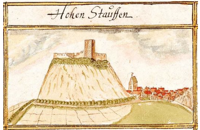
Die Stammburg der Staufer im heutigen Bundesland Baden-Württemberg

Die nachfolgenden Könige des Deutschen Reiches stammten aus dem Adelsgeschlecht der Staufer . Ihre Stammburg lag auf einem Berg in Schwaben. Sie waren die erklärten Feinde der Welfen aus Bayern . In Italien nannte man die Anhänger der Staufer Ghibellinen, die der Welfen Guelfen. Der volkstümlichste Kaiser aus diesem Geschlecht war Friedrich I., genannt Barbarossa . Um ihn ranken sich zahlreiche Legenden. Die Staufer kümmerten sich wenig um das Reich, lieber gingen sie auf die Jagd. Sie hielten sich vor allem in Italien auf oder gingen auf Kreuzzüge ins Heilige Land.