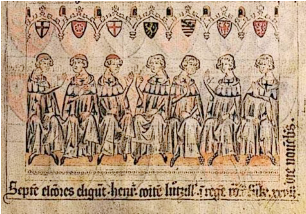
Die Kurfürsten im Jahr 1308. Fürsten, Erzbischöfe und Vertreter der Reichsstädte. Sie wählten den Kaiser.

Herzog mehr Steuern zahlen, da sie direkt dem (meist fernen) Kaiser oder König unterstand. Die Städte unterhielten eigene Fußtruppen zum Schutze ihres Handels. Das Marktrecht brachte gute Einkünfte. Sie schlossen oft mit anderen Städten ein Bündnis.