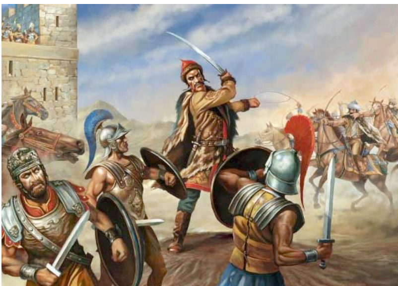
Attila (auch Etzel). Illustration aus einem Jugendbuch

Die Hunnen hatten seit der Unterwerfung des europäischen Raumes die ungarische Tiefebene bewohnt und von Tributzahlungen besiegt Fürsten gelebt. Jetzt zogen diese unheimlichen