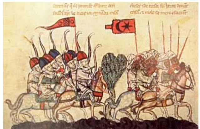
Hunnenzug (zeitgenössische Darstellung)

wurden vom Schreck so aufgewühlt, dass um 375 eine allgemeine Völkerwanderung begann. Ein Stamm nach dem andern brach auf mit Weib und Kind, rückte westwärts und drückte die Grenze des Römischen Reiches ein.