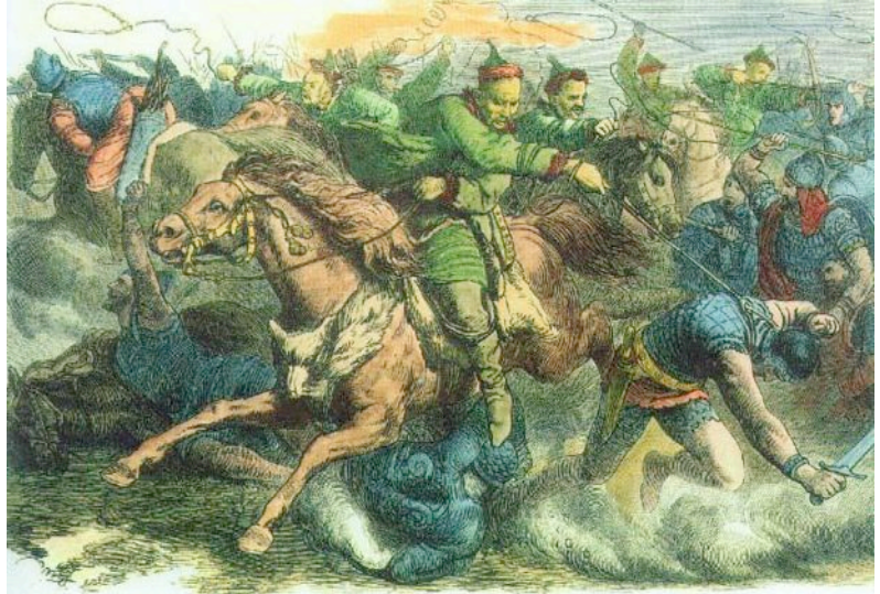
Hunnen im Kampf (Darstellung aus dem 19. Jh.)

Die größte Ausdehnung hat das Weltreich der Hunnen unter Attila. Nach seinem Tod im Jahre 453 zerfällt das Hunnenreich. Die Hunnen vermischen sich mit den Völkern Südosteuropas. Der Name Ungarn erinnert noch an das Volk aus den innerasiatischen Steppen.