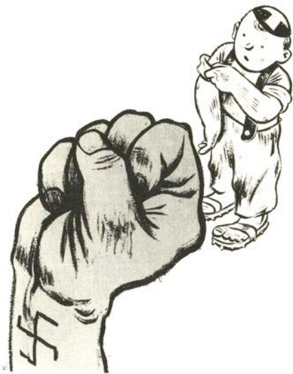
Sämtliche Schweizerzeitungen in Deutschland verboten! Der «Reichsdeutsche» der «Alemanne» der «Stürmer» in der Schweiz verboten.

Mit ein Grund, weshalb sich die Schweizerinnen und Schweizer der Wühlarbeit deutscher Agenten und der Frontisten gegenüber relativ resistent zeigten, mag die Erinnerung an den Franzoseneinfall von 1798 gewesen sein. Die Ausgangssituation war ähnlich. Aber das Volk damals war uneinig und verfiel den „Schalmeienklängen“ der „Neuerer“, die sich Patrioten nannten. Die französischen Truppen konnten die Eidgenossenschaft dank Vorarbeit der Wühler relativ mühelos besetzen, dann ausplündern und unterjochen und zu einem Vasallenstaat machen. Die Ereignisse lagen in den 1930er-Jahren zwar schon lange zurück, wurden aber in den Schulbüchern ausführlich und warnend behandelt. Zudem brachten die historischen Romane von Rudolf von Tavel („Ja gäll, so geits“) die Erinnerung an damals zurück. Übrigens waren von Tavels „Bestseller“ nicht in Hochdeutsch, sondern in Dialekt geschrieben, auch das ein Zeichen der Zeit und eine Art feiner Widerstand.