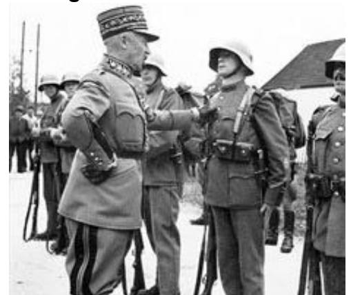
General Guisan war beliebt bei den Soldaten und in der Bevölkerung

Der General hatte keine leichte Aufgabe. Nach 1918 war mit der Stimmung „Nie wieder Krieg!“ die militärische Rüstung zurückgestellt worden. Erst ab etwa 1936 wurde wieder aufgerüstet. Pläne für den Kriegsfall gab es im August 1939 noch keine.