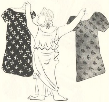
Helvetia und die Mode

Wie ein Wunder scheint es, dass sich die Schweiz mitten im schlimmsten aller Kriege als Friedensinsel bewahren kann. Wie schon im Ersten Weltkrieg wird das Land von den fürchterlichen Geschehnissen weitgehend verschont. Hat die Schweiz einen besonderen Schutzengel? Oder sind es Neutralität, die Armee, eine bodenständige Bevölkerung, eine umsichtige Politik, die günstige geografische Lage, Waffenlieferungen oder die Rolle als Bankier der kriegsführenden Nationen, welche die Schweiz wiederum vor Angriffen verschonen? Der „Sonderfall Schweiz“ wird noch heute zelebriert.