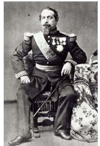
Der Vermittler. Der Neffe Napoleons war auch Schweizer Bürger. In Frankreich wurde er zuerst Staatspräsident, machte sich dann als Napoleon III. auch zum Kaiser der Franzosen.

Der Bundesrat schickte einen neuen Unterhändler zu Napoleon, der den Kaiser persönlich kannte. Napoleon versprach, er wolle für die Schweiz handeln, „als wäre er selber die Eidgenossenschaft.“ (Napoleon III. hatte schliesslich auch eine Zeitlang in der Schweiz gelebt, nämlich im Thurgau, und er hatte die Offiziersschule in Thun absolviert. Zudem besass er das Schweizer Ehrenbürgerrecht).