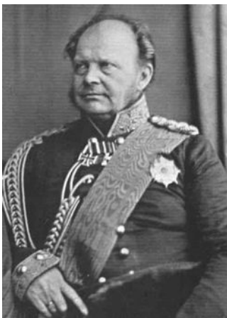
König Friedrich Wilhelm IV. von Preussen. Die deutsche Kaiserkrone hatte er 1848 abgelehnt, das Fürstentum Neuenburg hätte er 1857 gerne behalten.

Die Sympathien des Auslands lagen auf der Seite der Schweiz. Friedrich Wilhelm geriet in Verlegenheit. Der König von Preussen hatte mit dem Säbel gerasselt, nun sollte er ihn ziehen, worauf er aber ganz und gar keine Lust hatte. Denn er wusste, dass