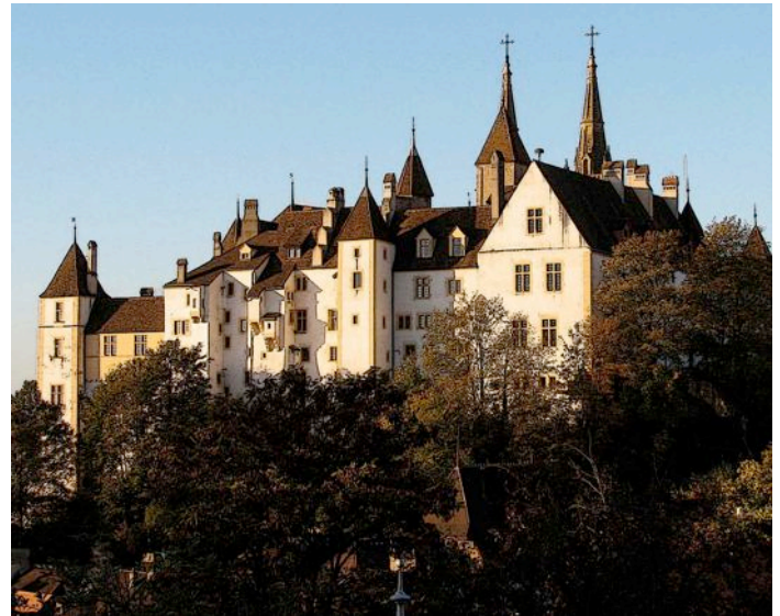
Das Schloss Neuchâtel thront über der Stadt und ist der Sitz der Kantonsregierung.

1848 ist auch das Jahr der Einführung der Bundesverfassung. Diese Verfassung macht die Schweiz zu einem selbständigen Bundesstaat, bestehend aus damals 22 Teilstaaten. Die Bürger dieser Kantone fühlen sich nun mehr und mehr als Schweizer. Es erwächst ein Nationalgefühl. Das zeigt sich erstmals sehr deutlich im sogenannten Neuenburgerhandel von 1856/57. Dabei ist das Wort „Handel“ in seinem damaligen Sinn von „Händel haben“, „Konflikt“ zu verstehen, und nicht als Austausch von Waren. Die junge freisinnige Schweiz trötelt gegenüber dem mächtigen Militärstaat Preussen.