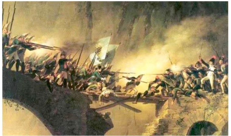
Am 25. September 1799 fanden in der Umgebung der Schöllenschlucht schwere Gefechte zwischen napoleonischen Truppen und den von General Suworow befehligten russischen Truppen statt. Die Teufelsbrücke wurde dabei schwer beschädigt. Erst dreissig Jahre später wurde eine neue Teufelsbrücke gebaut. In der Nähe steht das 1899 errichtete imposante Suworow-Denkmal, das an diese Schlacht im Zweiten Koalitionskrieg erinnert. Links auf der Brücke die von Süden hermarschierten Russen, rechts die Franzosen, welche sowohl das Vorderrheintal wie auch Uri, Glarus und Schwyz besetzt hielten.

Vorerst allerdings lief alles nach Plan. Mit seinen Russen, Kosaken, Kalmücken und Tartaren überquerte Suworow den Gotthard . Am 25. September kam es bei der Teufelsbrücke in der Schöllenschlucht zu blutigen Kampfhandlungen mit den Franzosen .