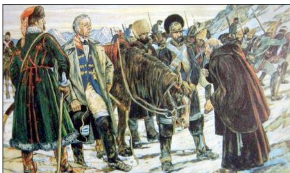
Suworow erreicht das Gotthard-Hospiz, 24. Sept.

Am 15. September 1799 marschierte der Generalissimus mit mehr 22 000 Mann ins Tessin ein, wo er dann sechs Tage lang in der Nähe von Lugano warten musste, weil die von der österreichischen Militärverwaltung versprochenen