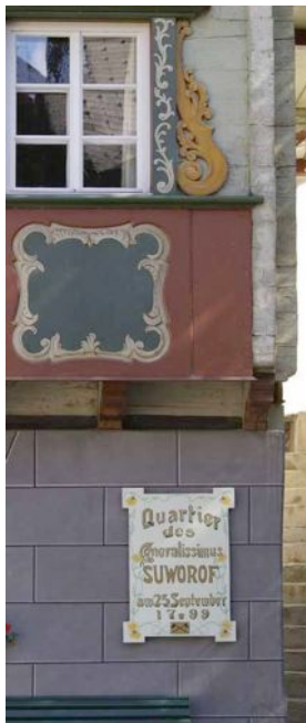
In Andermatt

schmalen Trampelpfade entlang den steilen Ufern des Vierwaldstättersees wären tödliche Fallen für die durchmarschierenden Truppen gewesen. Schiffe und Boote hatten die Franzosen weggeschafft.