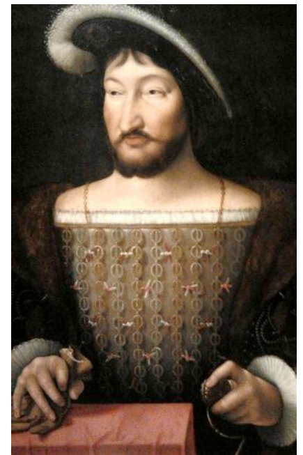
Der französische König François I er , auch le Roi-Chevalier genannt, war der Liebling des Volkes und des Adels. Er dürstete nach Kriegeruhm, war ein genialer Stratege, ein gewiefter Politiker und erkannte, wie er mit den Eidgenossen kutschieren musste. Er gewann die reiche Lombardei für die französische Krone.

1513 war mit Papst Julius II. der einzige zuverlässige Bündnispartner der Eidgenossen gestorben. In Frankreich kam zu Anfang 1515 Franz I. auf den Thron. Der junge König wollte Kriegeruhm erwerben und die reiche Lombardei für seine Krone gewinnen. Der Streit mit den Eidgenossen um das Herzogtum Mailand war seine erste Herausforderung. Sein Angebot von einer Million Kronen blieb ebenso erfolglos wie diplomatische Verhandlungen – ein bereits fertiger Vertrag wurde nur von den westlichen Schweizer Orten Bern, Freiburg und Solothurn sowie der Stadt Biel, nicht aber von den übrigen eidgenössischen Ständen anerkannt. Nun rüstete der Roi-Chevalier, wie der französische König auch genannt wurde, ein Heer von 60 000 Mann, mit viel Reiterei und 72 modernen Geschützen . Er verbündete sich mit den Venezianern, die nun Gegner der Schweizer geworden waren.