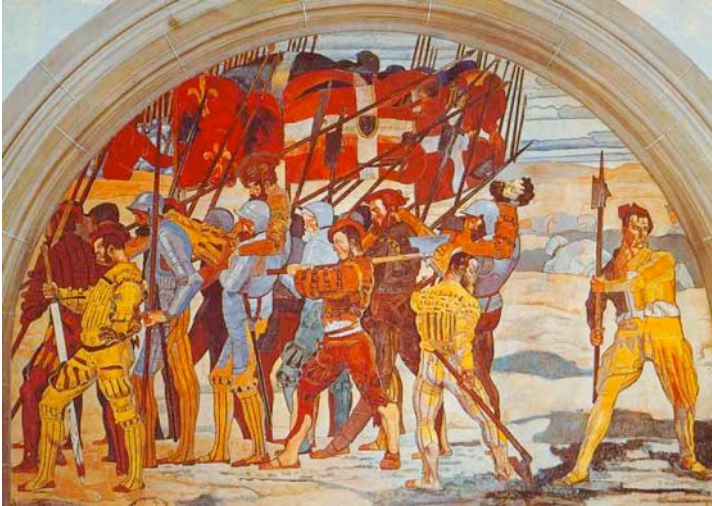
Wandbild von Ferdinand Hodler: „Rückzug von Marignano“ Idealisierende Darstellung Ende 19. Jahrhundert.

Dass der französische König die sich zurückziehenden Schweizer nicht verfolgen und vernichten liess, geschah dank seiner politischen Weitsicht. Zwar sprach man in der Schweiz im ersten Schmerz und Zorn über die Niederlage von einem Rachezug in den Süden.