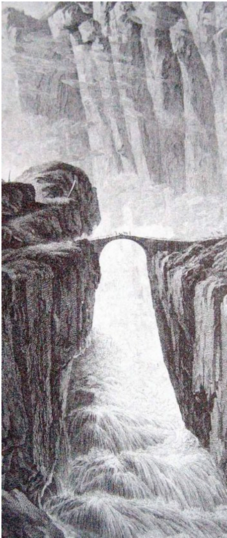
Die Teufelsbrücke über die junge Reuss in der Schöllenen. Stich von 1780.

Die abgelegenen Täler rückten in der Mitte des 13. Jahrhunderts in den Fokus der Weltgeschichte. Den Bewohnern des Urserentals war es gelungen, mit dem Bau der Teufelsbrücke die Schöllenschlucht passierbar zu machen und die Gotthardroute zu