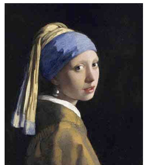
Vermeer: „Das Mädchen mit dem Perlenohrring“ 1665 - Die „Mona Lisa des Nordens“

Im protestantischen Holland verherrlichte der Barock die junge Republik anstatt des Papsttums oder des herrschenden Königs. Die Kunst führte hier vom Glauben weg zu atmosphärischen Wirkungen und menschlichen Gefühlen in der Malerei, deutlich sichtbar im Werk der beiden berühmtesten holländischen Künstler des 17. Jahrhunderts, Rembrandt und Vermeer .