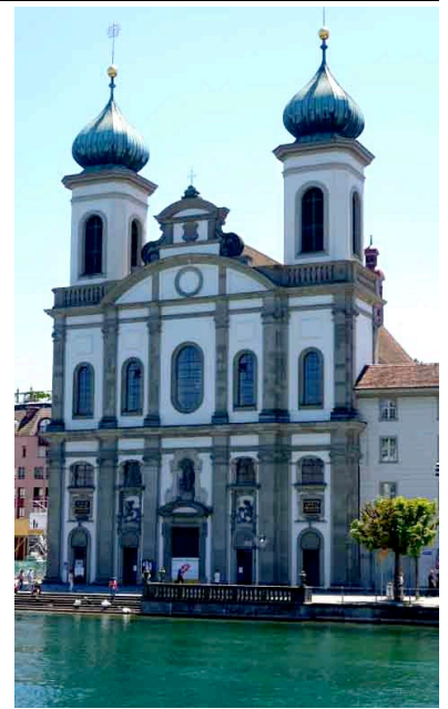
Jesuitenkirche in Luzern

Der Reformator Martin Luther und seine Gefolgsleute hatten die römisch-katholische Kirche wegen übertriebenen Prunks und übermäßiger Bilderverehrung kritisiert. Ein reformatorischer Bildersturm war über die Kirchen in den protestantischen Ländern hinweggefegt. Tausende von Kunstwerken waren von entfesselten Bilderstürmern zerstört worden.